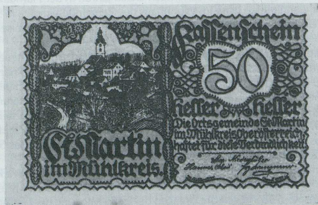
Notgeldschein, St. Martin i.M. 1920 Bild v. Max Kislinger

Die SPARKASSE-MÜHLVIERTEL-WEST beschäftigt rund 90 Mitarbeiter, die durch ständige Schulung für fachkundige Bedienung und Beratung der Kunden sorgen. Das Führungsgremium unseres Institutes ist ein hauptamtlicher Vorstand, der Sie auch im Namen aller Funktionäre der Sparkasse ersucht, uns in St. Martin Ihr Vertrauen zu schenken.