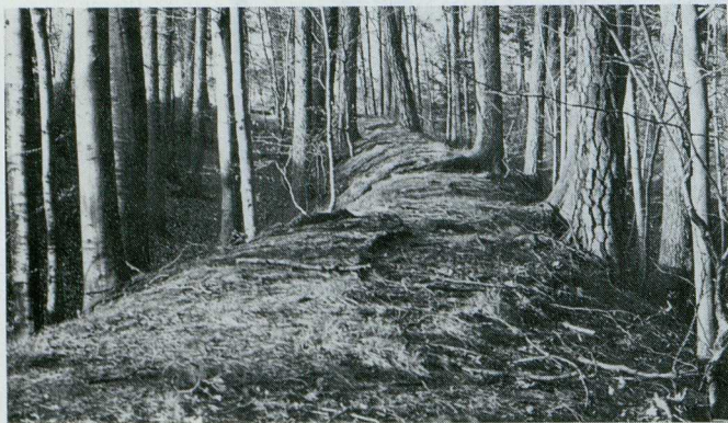
Altweg am Mitternberg (Unterhart)

Donau, im Gemeindegebiet St. Martin, sowie Einzelfunde und alte, zum Teil erhaltene Hohlwege bestätigen diese Annahme. (Funde im O.Ö. Landesmuseum, Linz). Sicherlich benutzten