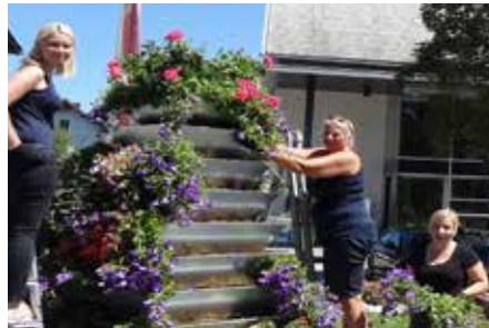
Fleißige Helfer beim Bepflanzen der Blumenpyramide.

In Zusammenarbeit mit dem Blumenhaus Mayr aus Lenzing wurde die Idee geboren, eine Blumenpyramide aufzustellen und vor die Kirschlorbeerhecke rosa Hortensien zu pflanzen. Ein großer Vorteil der Blumenpyramide ist, dass die bestehende Pflasterung und der Sockel aus Granitsteinen bestehen bleiben können. Die Bewässerung der Pflanzen erfolgt selbstständig durch einen integrierten Wasseranschluss. Die Gestaltung des Platzes kann zudem zukünftig flexibel an die Jahreszeit angepasst werden.