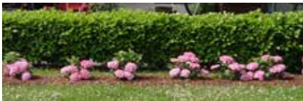
Die Hortensien vor der Kirschlorbeerhecke kommen durch das saftige Grün besonders zur Geltung.

Seither wurden viele Überlegungen angestellt, was man an der nun frei gewordenen Stelle platzieren könnte. Sie reichten von einem lebenden Baum, zu einem Dorfbrunnen und vielen weiteren Ideen. Nach reiflicher Überlegung und Abwägung aller Vor- und Nachteile wurde der Entschluss gefasst, dass es sich bei der Neugestaltung um einen Blickfang handeln soll, der mit vielen bunten Blumen den Platz freundlich und einladend gestaltet.