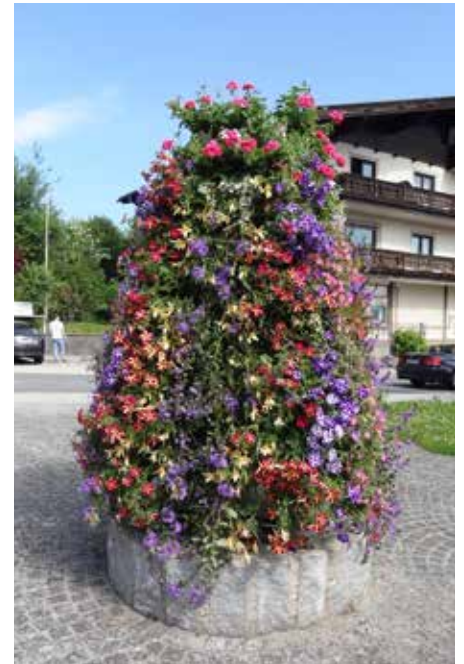
Nach dem Motto „Jedem Menschen recht getan, ist die Kunst die niemand kann“ hoffen wir, den Geschmack vieler Bürger getroffen zu haben.

In Zusammenarbeit mit dem Blumenhaus Mayr aus Lenzing wurde die Idee geboren, eine Blumenpyramide aufzustellen und vor die Kirschlorbeerhecke rosa Hortensien zu pflanzen. Ein großer Vorteil der Blumenpyramide ist, dass die bestehende Pflasterung und der Sockel aus Granitsteinen bestehen bleiben können. Die Bewässerung der Pflanzen erfolgt selbstständig durch einen integrierten Wasseranschluss. Die Gestaltung des Platzes kann zudem zukünftig flexibel an die Jahreszeit angepasst werden.