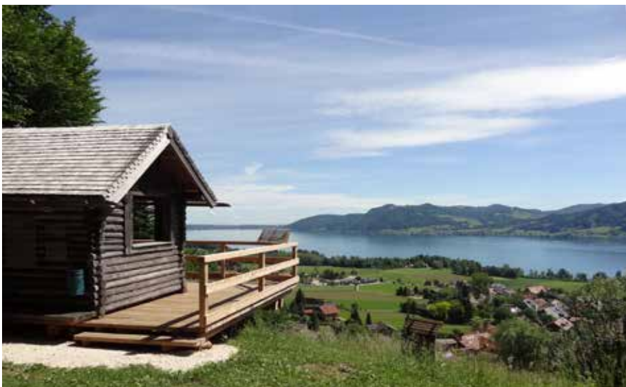
Ausblick vom „Pfarrer Salettl“.

Im Jahr 2009 wurde der Wildholzweg zum „Pfarrer Salettl“ feierlich eröffnet. Seither zählt er zu den beliebtesten Wanderzielen in unserer Gemeinde und ist weit über die Gemeindegrenzen hinweg bekannt.