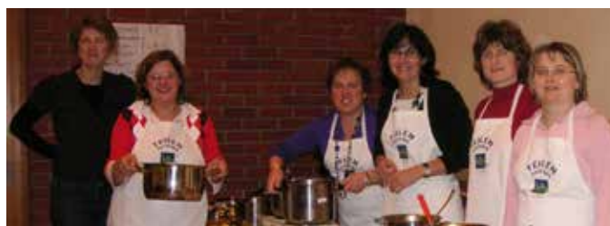
Suppentag anlässlich Familienfasttag 2009