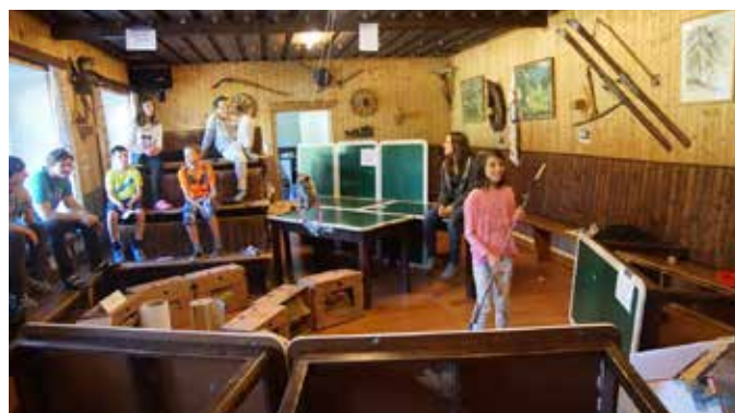
Minigolf durch das ganze Haus