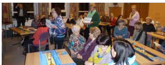
Ökumenischer Weltgebetstag, Land Bahamas, 2015, Evangelische Kirche