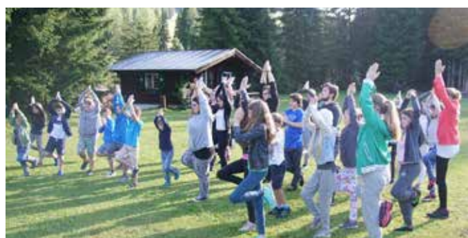
Früh am Morgen