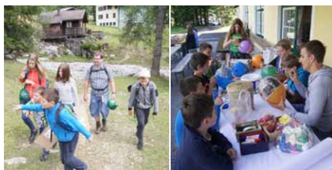
Die Helden müssen sich bewähren