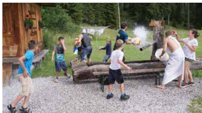
Wer schafft es nicht nass zu werden?