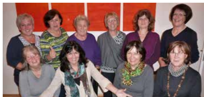
kfb Arbeitskreis 2014