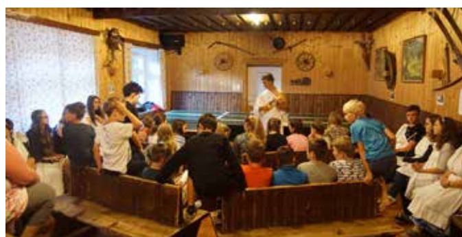
Werden die Helden in den Olymp aufgenommen?