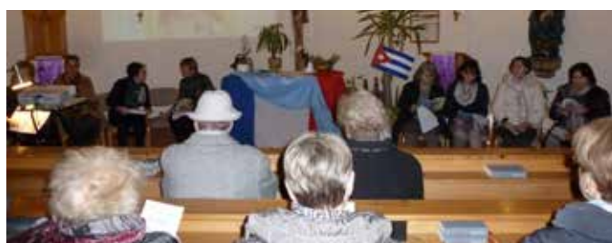
Ökumenischer Weltgebetstag, Land Kuba, 2016, Katholische Kirche