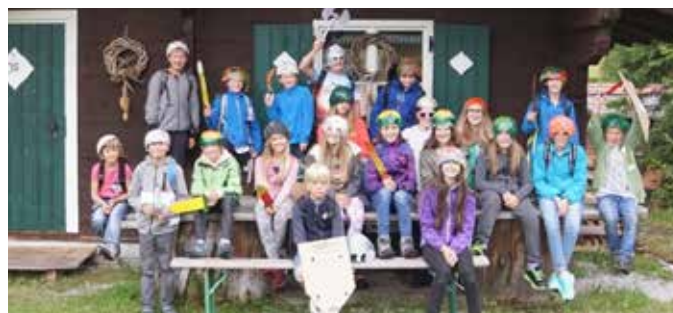
Die Helden sind ausgerüstet für den Postenlauf