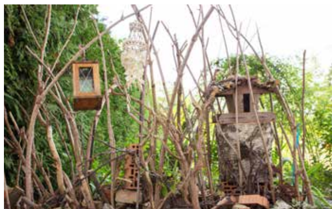
Lebensbögen im Pfarrhofgarten gestaltet von P. Edwin

Wir danken dir für das Leben aller uns lieb gewordener Menschen, die bereits zu dir zurückgekehrt sind; für alles Glück, das wir miteinander erleben durften, und für alles, was wir einander geben und bedeuten konnten. Amen.