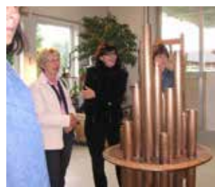
kfb, vor der in Auftrag gegebenen Kindergedenkstätte 2006

Im nächsten Pfarrblatt stellen wir Ihnen dann das neue Jahresthema der kfb vor! Mehr Infos über die kfb, die Aktivitäten und Veranstaltungen, finden Sie im Internet unter: www.dioezese-linz.at/kfb