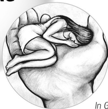
In Gott geborgen