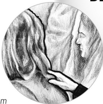
Vom Paten gestützt