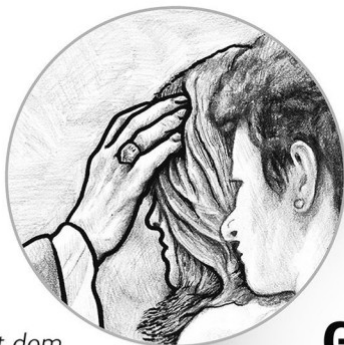
Mit dem Geist gesalbt