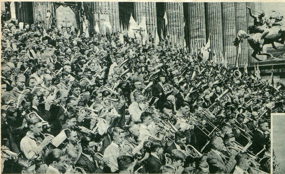
Das Lied der Jungen 600 Posaunenbläser spielten beim 75. Bundesfest der Evangelischen Jungmännervereine im Berliner Lustgarten.