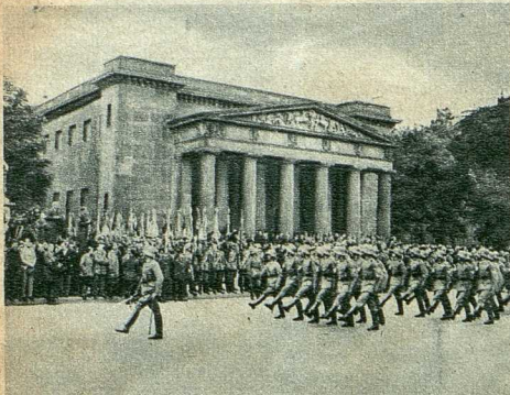
Das Ehrenmal der Weltkriegsopfer

Die Schinkel'sche „Neue Wache“, unter den Linden in Berlin, ist zur Gedenkstätte für die gefallenen Weltkriegsopfer ausgestaltet worden. — Parade des Berliner Wachregiments während der Einweihungsfeier.