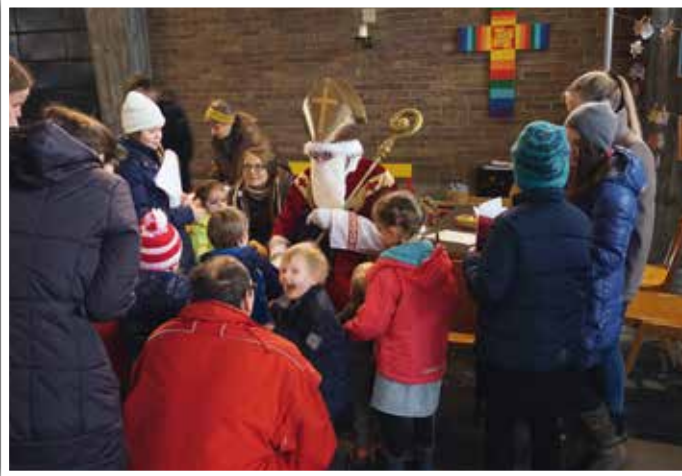
▲ Nikolaus in der Kirche