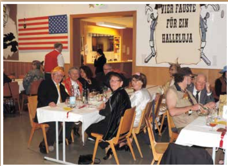
▲ Pfarrball unter dem Motto Hollywood