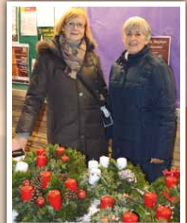
Kein Advent ohne Adventkränze