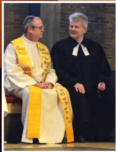
▲ Ökumenischer Gottesdienst am 17. Jänner