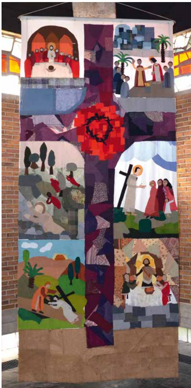
Vor vielen Jahren hat die KFB unserer Pfarre dieses Fastentuch angefertigt

MITTEILUNGEN AUS DER RÖM.-KATH. PFARRE ST. STEPHAN WELS-LICHTEGEG