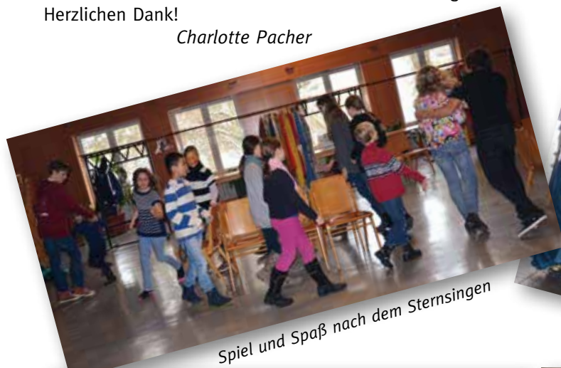
Spiel und Spaß nach dem Sternsingen