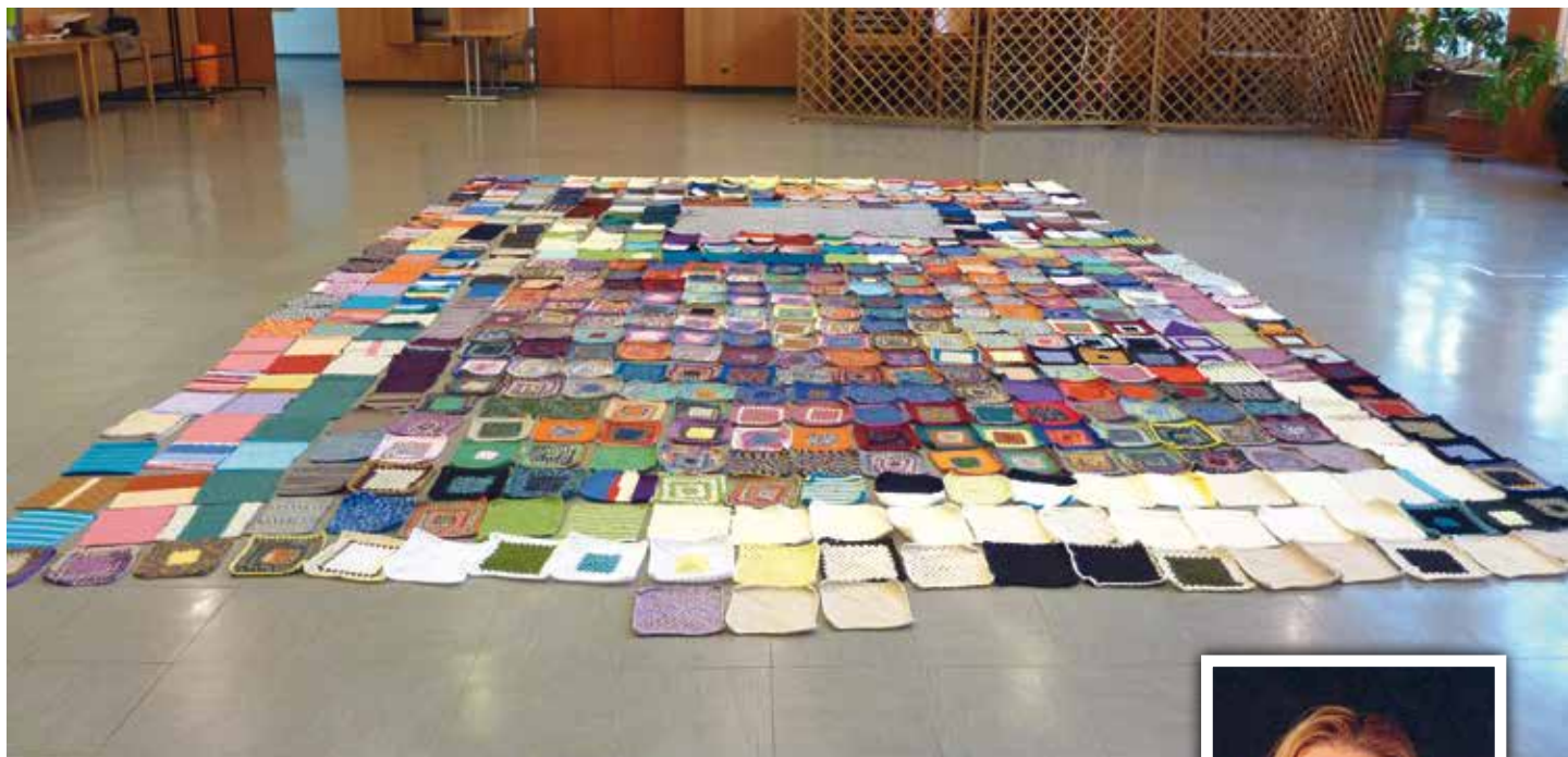
Ein beeindruckendes Werk ist die Decke aus unserer Pfarre geworden.