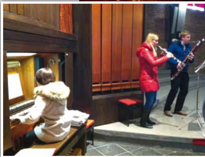
◀ Musikalischer Advent am 6. Dezember