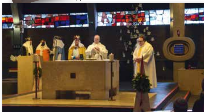
Sternsinger-Gottesdienst am 6. Jänner