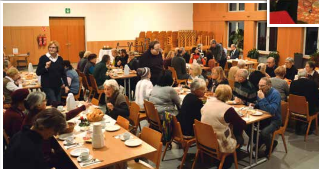
◀ Frühstück nach der Rorate am 8. Dezember