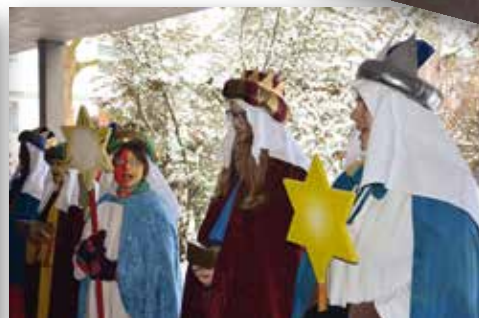
Die Sterne warten auf's nächste Jahr