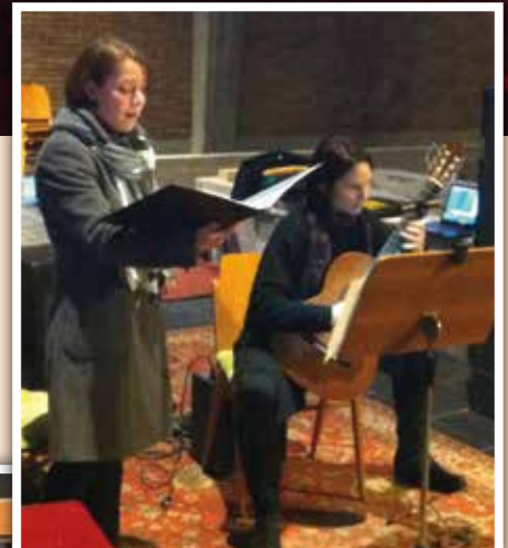
▲ Musikalischer Advent am 20. Dezember