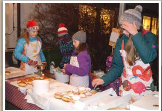
Junge, aber erfahrene Krapfen-Bäcker