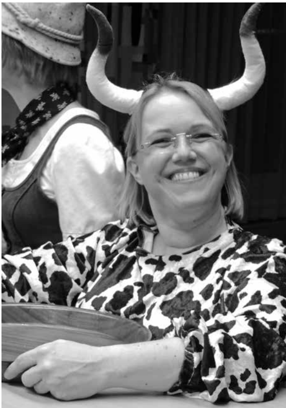
▲ I moa, i hab mei Kuahglock'n verlor'n