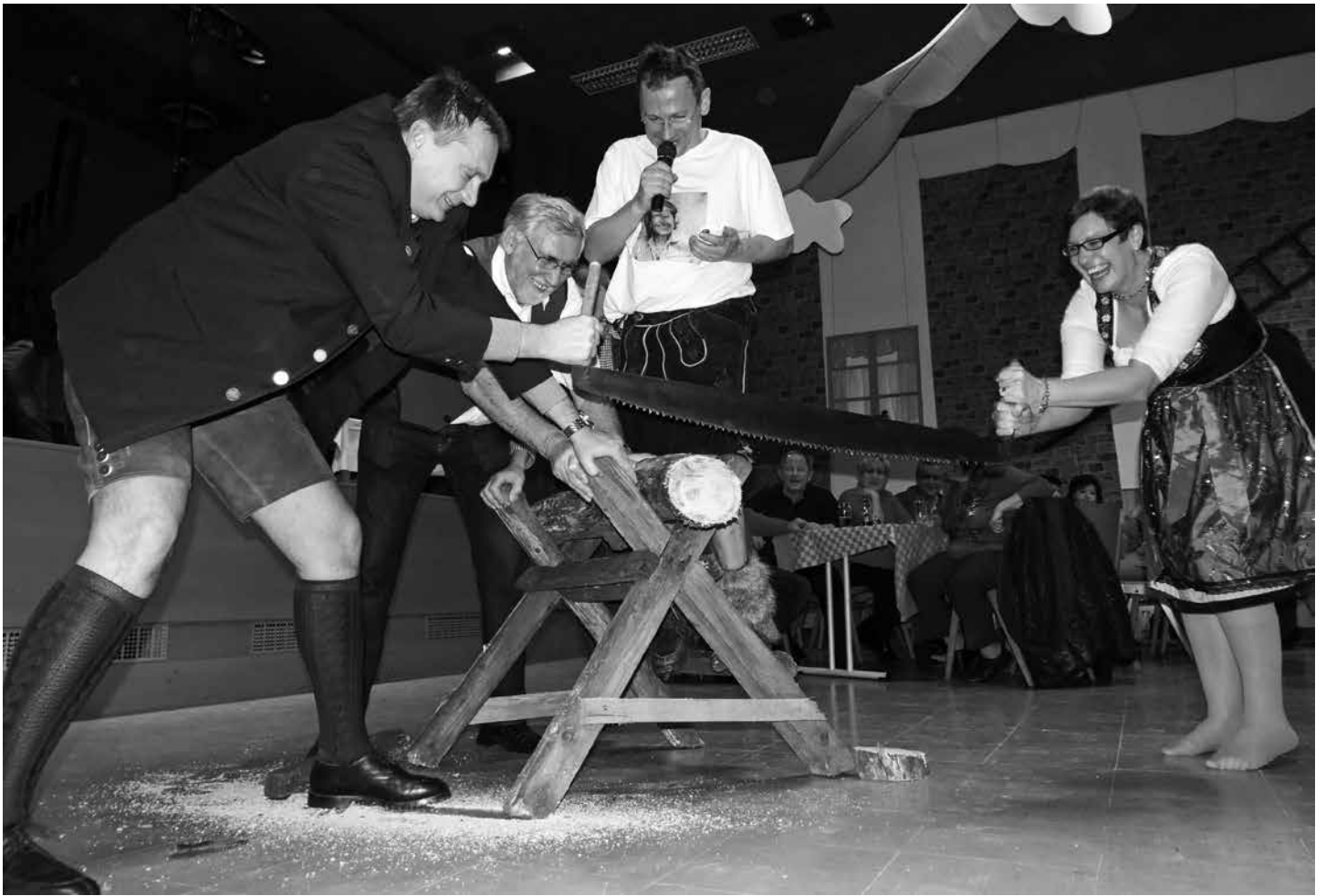
▲ Aufpass'n auf d' Finger!