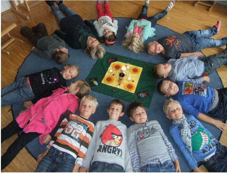
Feierkreis der 1. Klasse

Nicht nur die Kinder der 1. Integrationsklasse, sondern die ganze Schulgemeinschaft der Johann-Eisterer-Landesschule, freut sich auf regen Besuch am