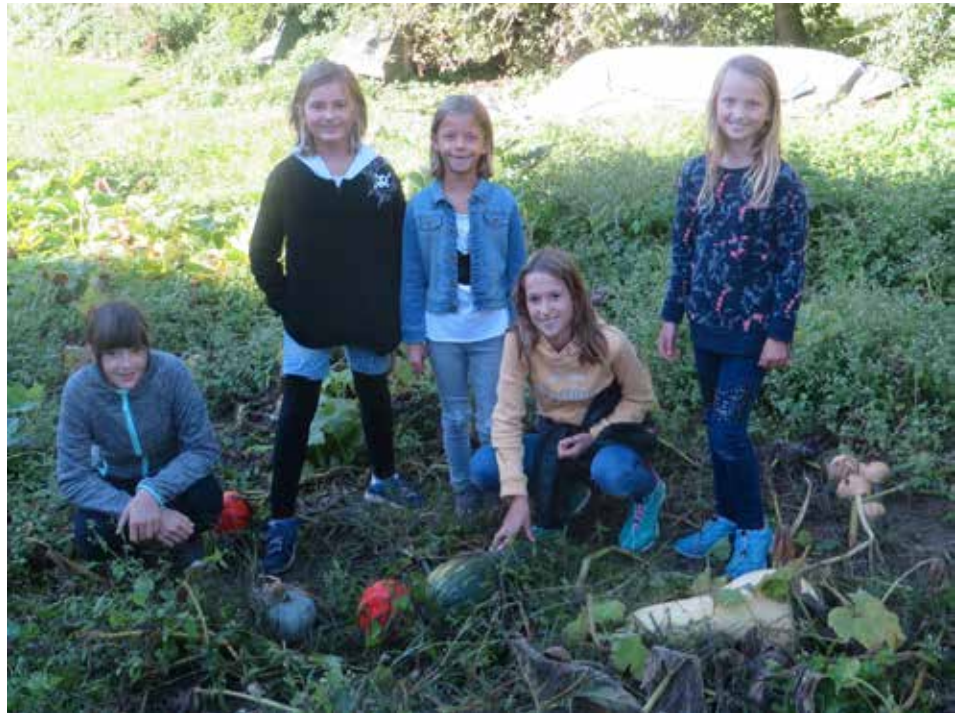
Die VolksschülerInnen mit ihren gezüchteten Kürbissen