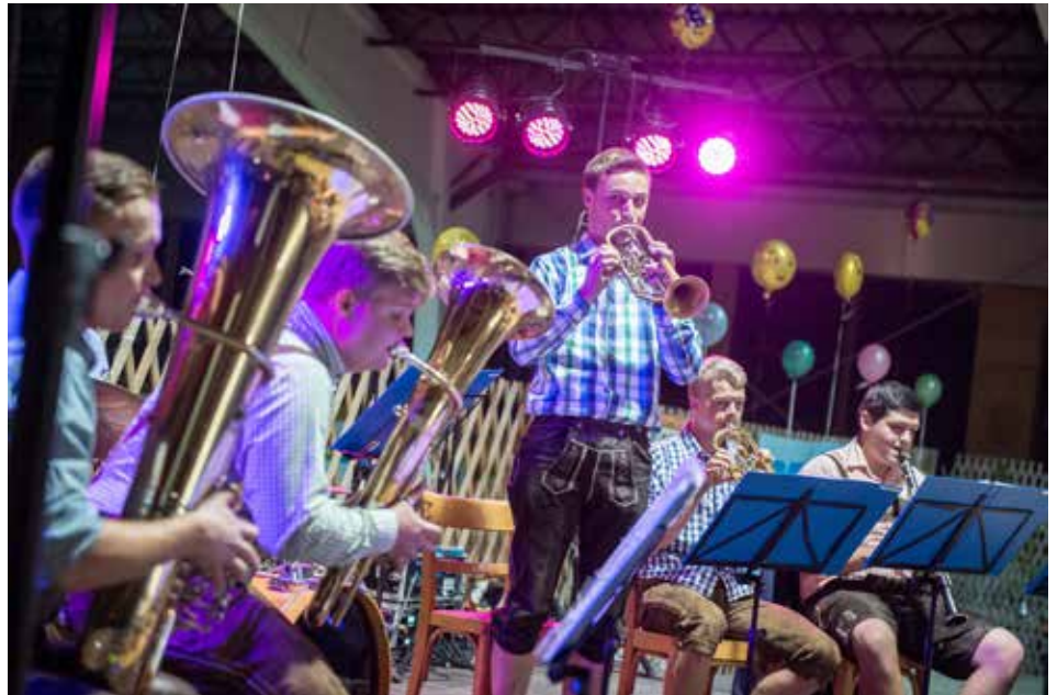
Blasmusik trifft Austropop bei der 145 Jahr-Jubiläumsfeier des MV Schönering

Ausdrucksstarke, stimmungsvoll berührende, kraftvoll-zärtliche Kompositionen mit bewegenden Texten, die Herz und Seele erreichen – jeder Song ein Hit und das Publikum war von der ersten Minute an begeistert dabei. Auch unsere beiden Musikvereine bereicherten den Wilheringer Kultur-