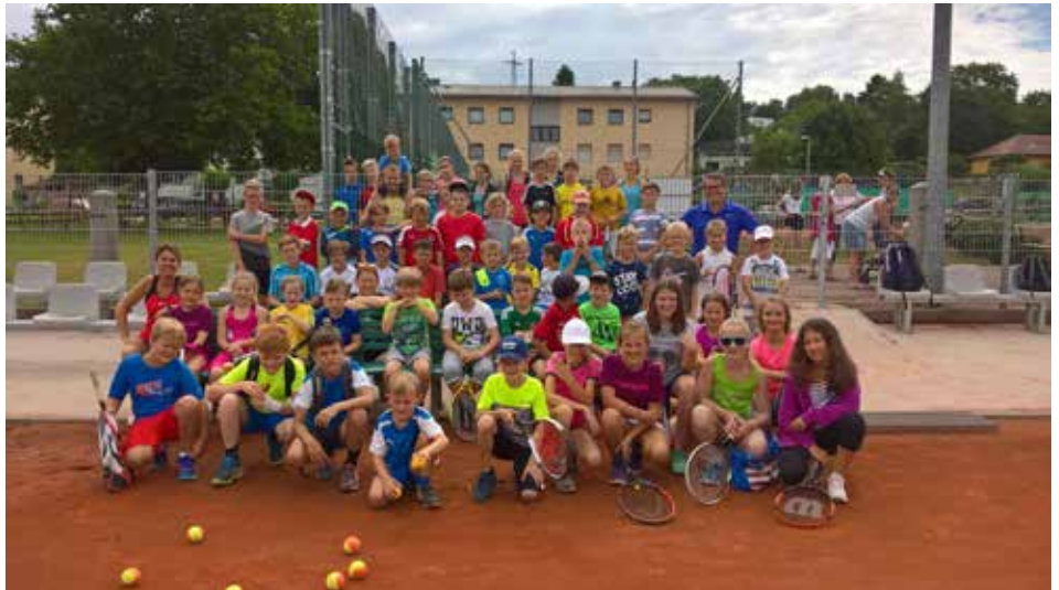
Bei der Ferienpass-Veranstaltung konnten wir hoffentlich einige Kinder vom Tennissport überzeugen.

Wir können uns weiterhin über einen Aufschwung im Tennis freuen, darum Danke an unsere Mitglieder für ihr Verständnis und ihre Leidenschaft für Tennis und der Marktgemeinde Wilhering für ihre Unterstützung und das Verständnis für unsere Anliegen.