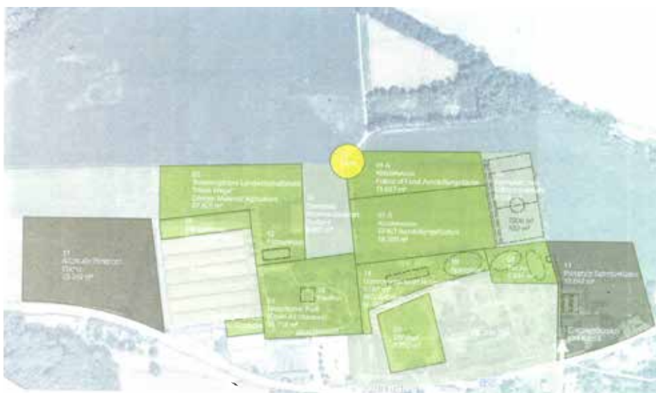
Heutiges Konzept auf sehr kleinem Areal rund um die Stiftsgärtnerei

dass die Pläne des Abtes sich als Stift zu verändern und zu öffnen stetig fortzuschreiten.