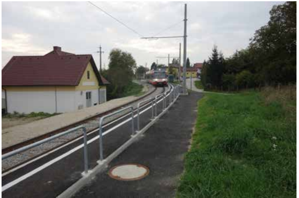
Bahnsteigverlängerung bei der LILO Station in Hitzing

Zu diesem Thema werden immer wieder Jahreszahlen (2030) angegeben, die ich mir als Laie nur schwer vorstellen kann (2030 ist in 12 Jahren!).