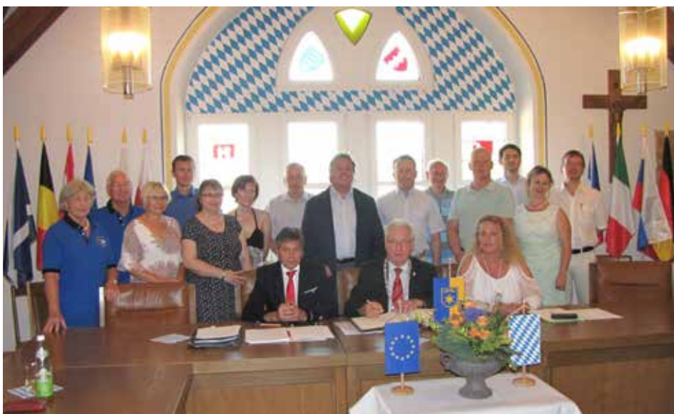
Vertreter der Partnergemeinden zu Besuch in Bogen

Die Partnergemeinden kommen aus Tschechien, Italien, Frankreich, Deutschland und Russland. |