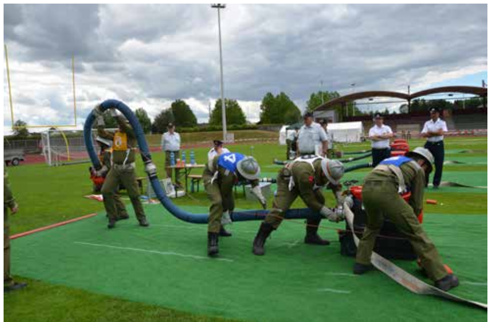
Die Bewerbungsgruppe der FF Schönering beim Aufbau der Saugleitung im Pumpenbereich.

Das Kommando der Feuerwehr Schönering gratuliert recht herzlich zu der erbrachten Leistung.