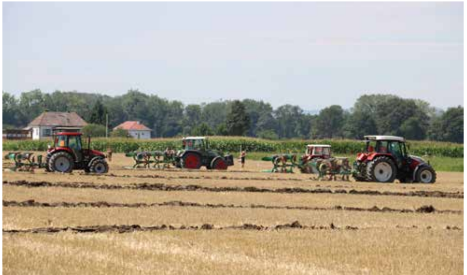
Beim Pflügerbewerb zeigten die Jungbauern ihr Können

Auf die Furche, fertig, los – hieß es am Sonntag, den 30. Juli 2017, beim Bezirkspflügen der Landjugend Linz-Land. Heuer wurde der Pflügerbewerb von der Landjugend Oftering-Wilhering bei der Saatbau-Maiszuchtstation am Feld der Fam. Nöbauer in Schönering ausgetragen. Landjugendliche aus der Region bewiesen in drei unterschiedlichen Wertungen (Dreh-, Beet- und Oldtimerpflug) ihr Geschick beim Furchenziehen. Es ging um Sauberkeit, Gleichmäßigkeit, einen exakten Abschluss zur Nachbarparzelle und das Einpflügen des gesamten Strohs.