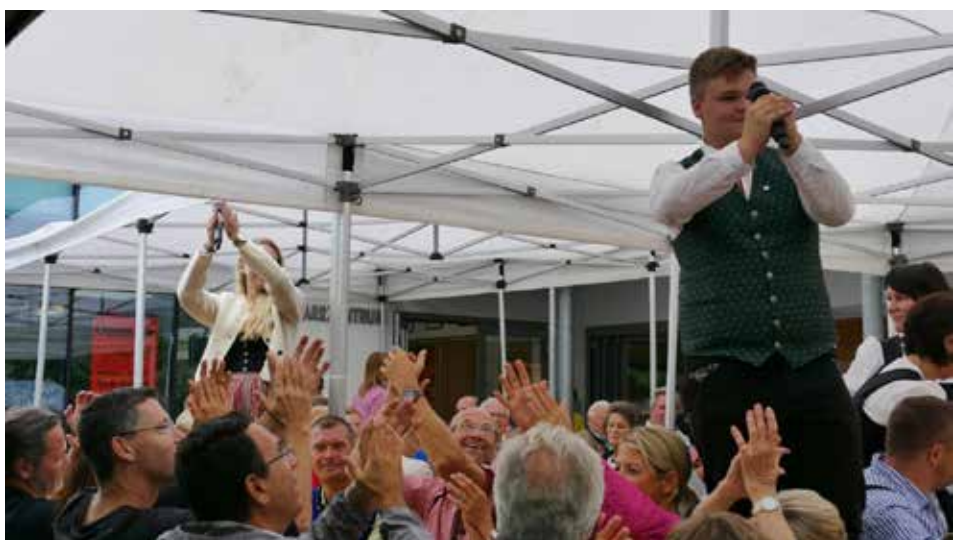
Die Showmaster heizen das Publikum an

All jenen, die wegen des Regens nicht gekommen sind, sei gesagt: „Ihr habt da echt was versäumt!“