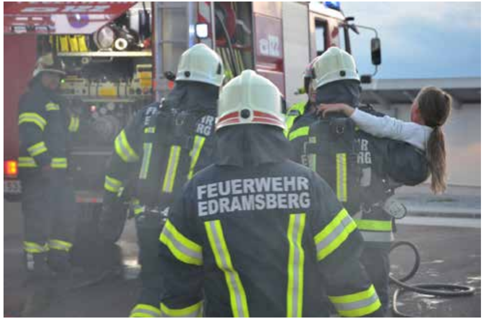
Übung für den Ernstfall

Binnen kürzester Zeit konnten unsere Atemschutzträger in der dicht verrauchten Garage einige Vermisste ausfindig machen. Da eine der zu Rettenden noch bei Bewußtsein war, wurde sie ohne zu zögern und ohne den Einsatz etwaiger Rettungsgeräte umgehend ins Freie gebracht. Selbige war in der Lage, den Einsatzkräften den Verbleib einer vierten Person im Kofferraum eines Autos mitzuteilen. Der Atemschutztrupp, welcher aufgrund der noch recht kurzen Einsatzzeit über ausreichend Atemluftreserven verfügte, begab sich augenblicklich