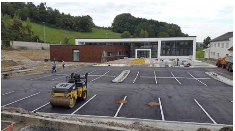
Blick auf den Vorplatz und das Gemeindeamt Ende September

Ebenso soll der Parkplatz vor dem Amt beleuchtet werden.