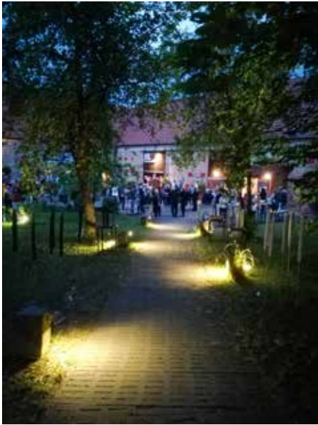
Blick auf die Stiftscheune