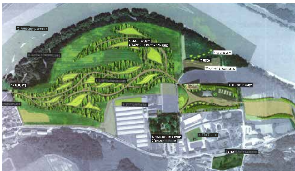
Ursprüngliches Konzept für das große Areal der Stiftsgründe

Diese Vorhaben des Stiftes laufen mittlerweile sehr gut. Die Gemeinde sieht dies sehr positiv und man merkt,