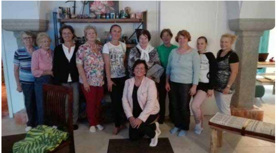
Die Ortsbäuerinnen zu Besuch bei „Salz des Lebens“