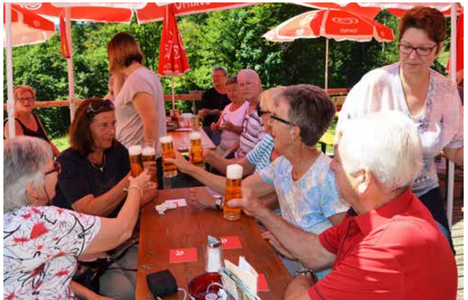
Auf da Alm da gibt's koa Sünd

Die Almkäserei versorgte uns nicht nur mit herrlichen nussigen Almkäsen, sondern auch mit kühlen Getränken. Nach der ersten Stärkung erkundeten wir die vielfältige Almenlandschaft