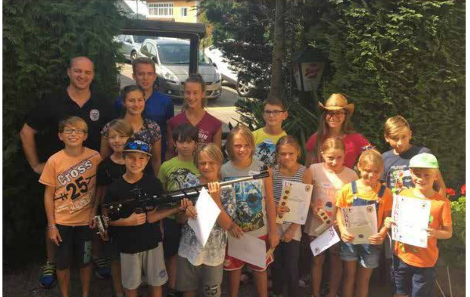
Kleinkaliber schnuppern in Enns und die Kinder beim Ferienspiel

Wir wünschen allen viel Erfolg bei den kommenden Wettkämpfen.