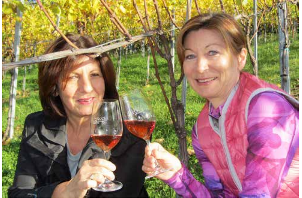
Beim „Wein im G'wölb“ am 17.11. werden ausgesuchte Tröpferl kredenzt

„Wir freuen uns auf den Besuch von Weinkennern aus der Umgebung, weil wir mit dem geschichtsträchtigen Gewölbe in der Musikschule eine nicht alltägliche Örtlichkeit anbieten können“, betont Organisator und Mühl-