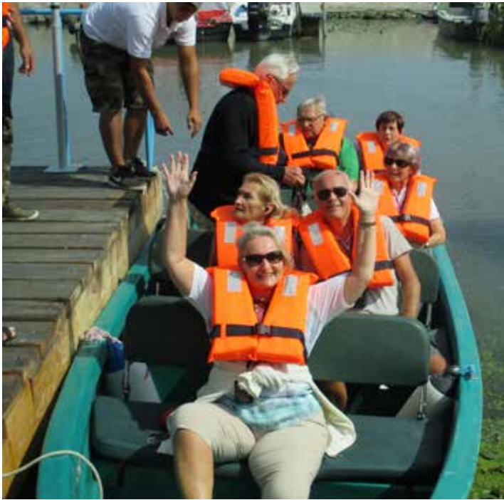
Lustige Bootsfahrt im Donaudelta