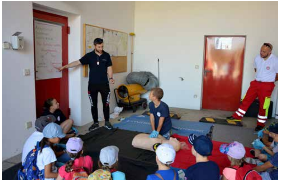
Kinder lernen die Rettungskette

Wir bedanken uns bei der Österreichischen Rettungshundebrigade Gruppe Wels, bei unseren Mitarbeitern für