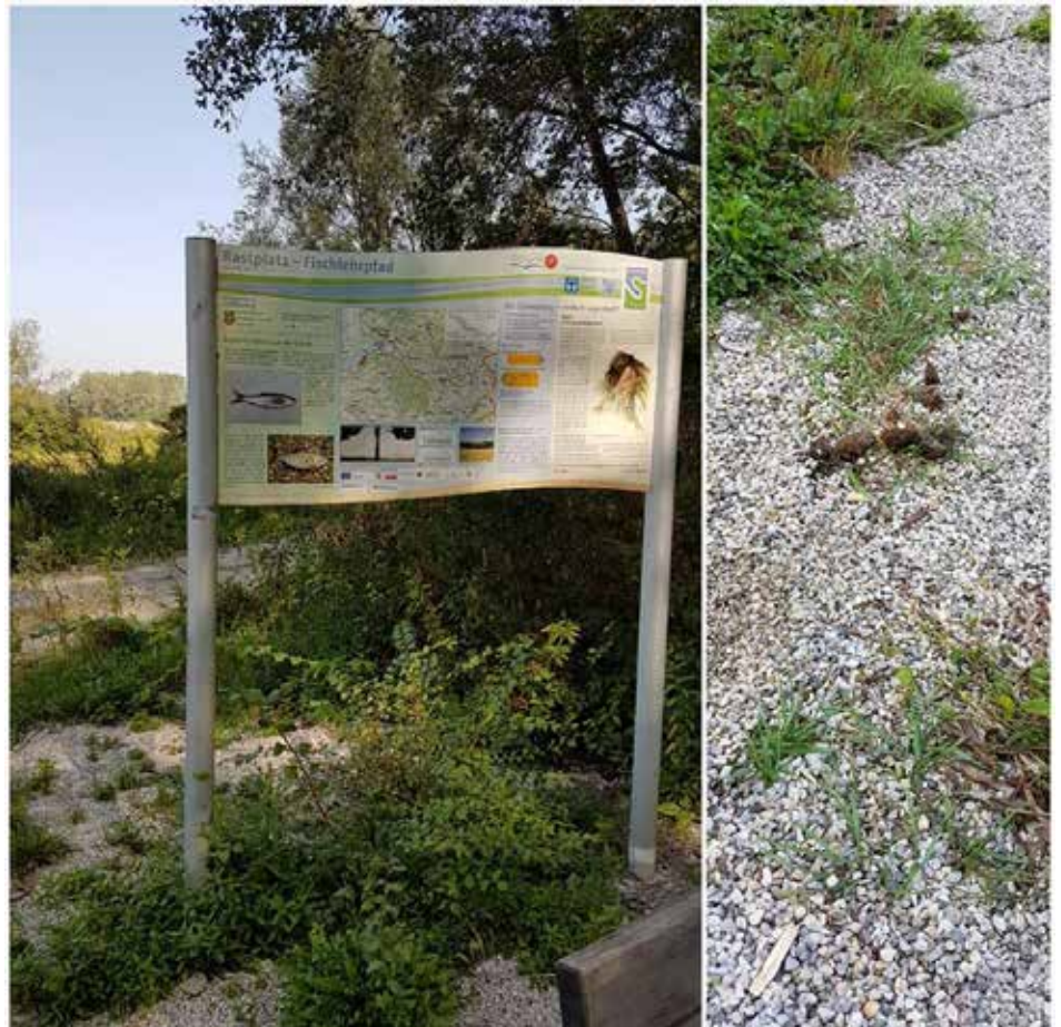
Hinterlassenschaften am Fischlehrpfad: HundehalterInnen werden aufgefordert, die vorhandenen Gassi-Sackerl mit Mülleimer zu benutzen!

Es wird auch lobend angemerkt, dass die Gemeinde schon sehr viele Gassi-Sets aufgestellt hat. Bitte nutzen Sie unsere Angebote. |