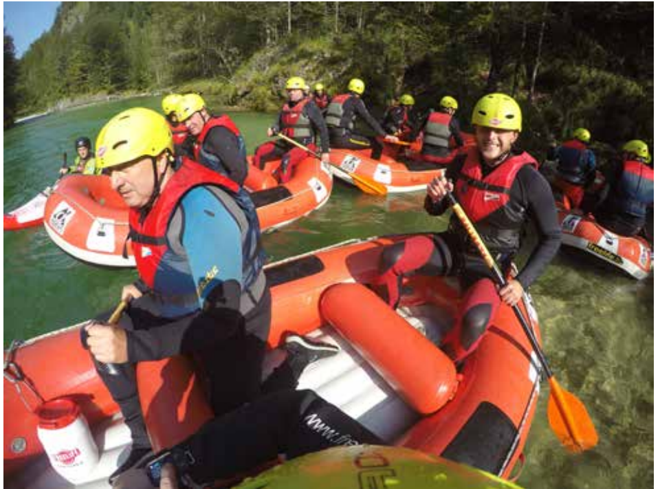
ACTIVE DAY Raften auf der Salza

Und so blieb der Jungvater zu Hause, während sich 20 Kameradinnen und Kameraden am 09.09.2017 zum ACTIVE DAY nach Palfau aufmachten. Bereits in früheren Jahren waren einige