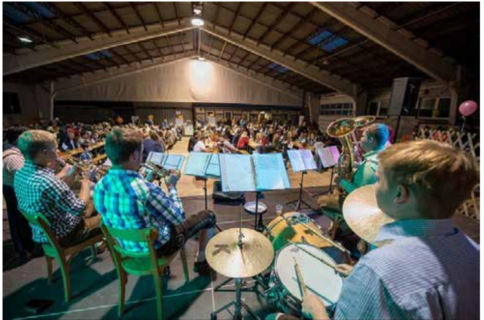
Blick auf die volle Halle bei der 145 Jahr-Feier

Im Zuge der Ferienpass-Aktion der Gemeinde lud der Musikverein Schönering am 21.07.17 gemeinsam mit dem Musikverein Dörnbach zahlreiche Kinder in das Probelokal des MV Schönering. MusikerInnen präsentierten den Kleinen verschiedenste Instrumente, welche natürlich auch sofort ausprobiert werden durften. Da heuer das Wetter perfekt war, folgten lustige Spielchen im Park vor der Volksschule