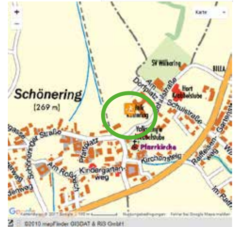
Fitnesspark am Dorfplatz (neben Klinik Wilhering)

Die Fitnesstipps wurden zur Verfügung gestellt von der Firma Free Gym.