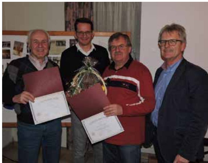
Die bisherigen Sektionsleiter der Sektion Ski- und Turnen