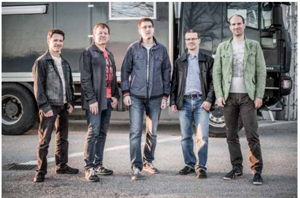
Aufdraht lädt in den Jam Club ein

Am 21. Juni 2007 ist Georg Danzer im 61. Lebensjahr einem Krebsleiden erlegen. Sein Todestag jährt sich heuer zum 10. Mal – für die Austropop-Enthusiasten von „Aufdraht“ Anlass genug, die unvergesslichen Danzer-Songs gebührend zu zelebrieren.