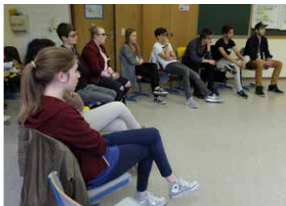
15 Jugendliche nahmen am Workshop teil und diskutierten ihre Anliegen für Wilhering