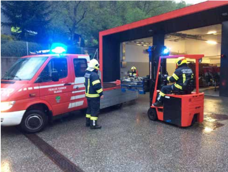
Beim Verladen von Sandsäcken FF Wilhering