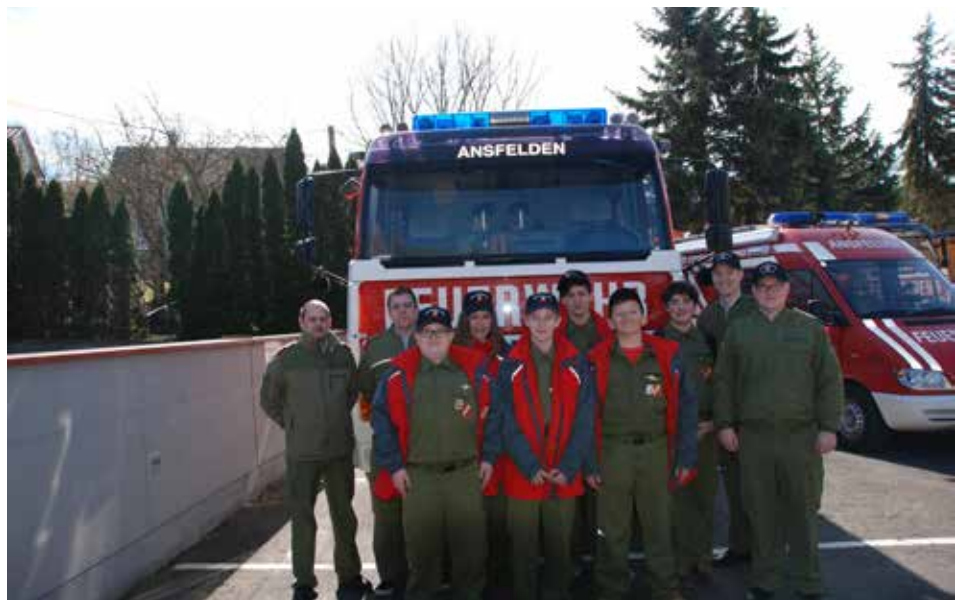
Die erfolgreichen Teilnehmer beim Wissenstest mit ihren stolzen Betreuern

Die erfolgreiche Absolvierung des Grundlehrganges ist die Voraussetzung im aktiven Feuerwehrdienst, um sämtliche Kurse und Lehrgänge an der OÖ Landesfeuerwehrschule besuchen zu dürfen.