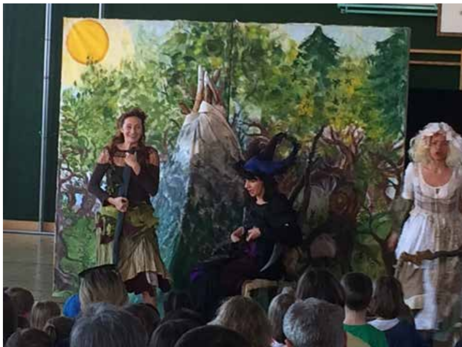
Die kleine Hexe brachte die Kinder zum Staunen

Liebe Wilheringerinnen, liebe Wilheringer!