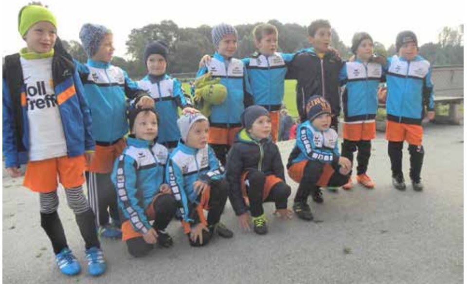
Die jungen Fußballer

Beim Heimsieg in der ersten Runde gegen Pucking haben auch die Jüngeren aufgezeigt und schon angedeutet, dass bald mit ihnen zu rechnen sein