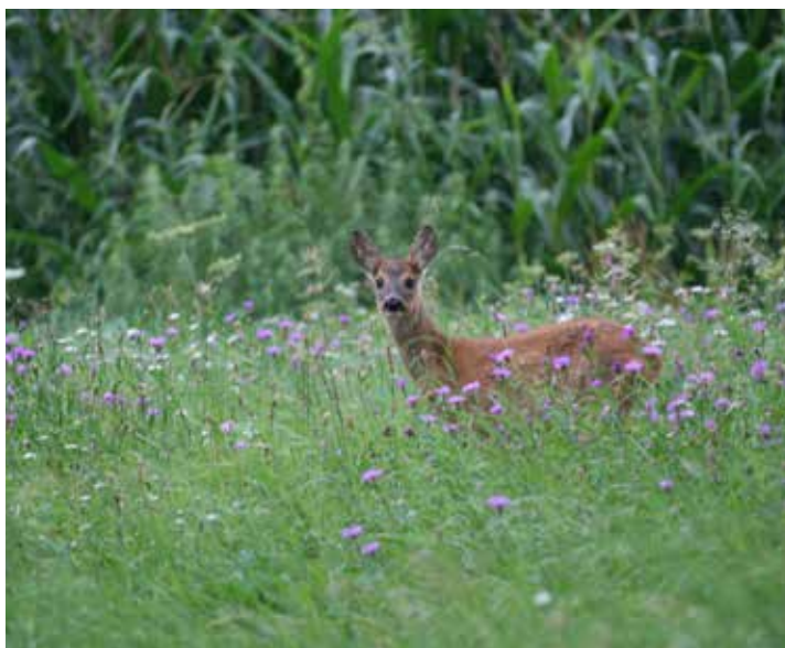
Reh im Klee