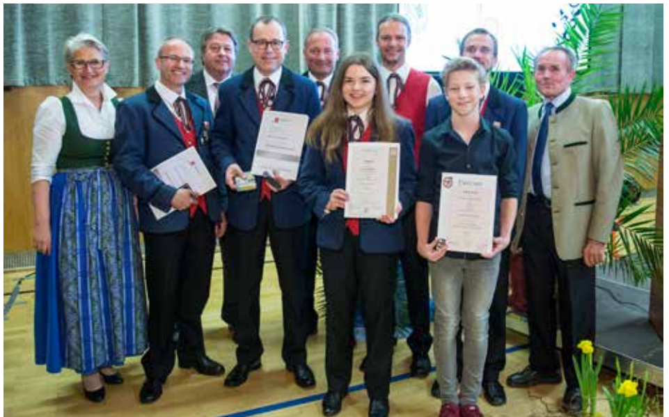
Die Musiker wurden am Frühjahrskonzert geehrt

Die Highlights: Die Wertungsstücke „CMYK“ und „Around the world in 80 days“, „Im weißen Rössl“ von Ralph Benatzky und das Potpourri „Best of Falco“ (arr. Stefano Conte). Sehr gut angenommen wurde der erstmalige gemütliche Ausklang des Konzertes im Turnsaal bei Speis, Trank und Musik.