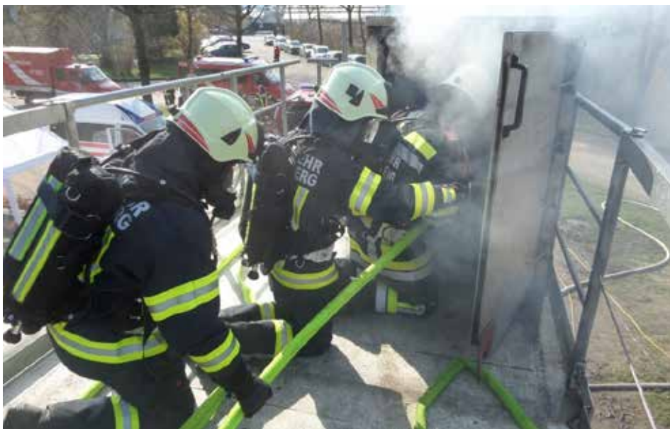
Die Feuerwehrkameraden auf Schulung in der Brandsimulationsanlage

In dieser Brandsimulationsanlage wurden verschiedenste computergesteuerte, gasbefeuerte Brandherde unter Supervision durch je einen Ausbildner mit den einzelnen Trupps durchlaufen. Bereits am 24.03. abends starteten