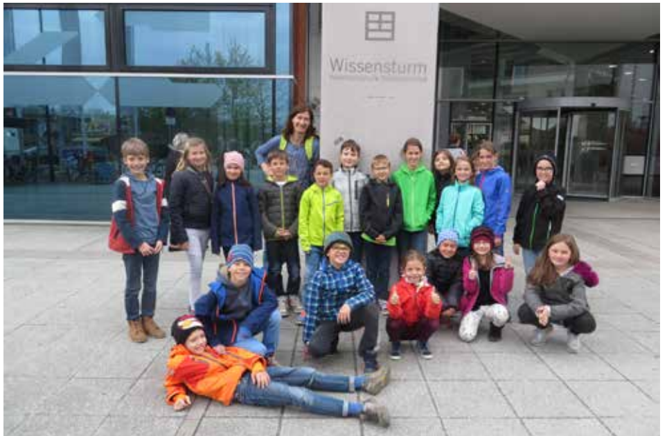
Schülerinnen und Schüler suchten sich im Wissensturm Lesestoff für die Lesenacht

Am nächsten Morgen waren wieder ein paar Heinzelmütter am Werk, die uns ein leckeres Frühstück zauberten. Manche vergruben sich danach sofort wieder in ihren Büchern. Spätestens jetzt machte sich bemerkbar, dass einige von uns nur wenig geschlafen hatten, und viele mussten