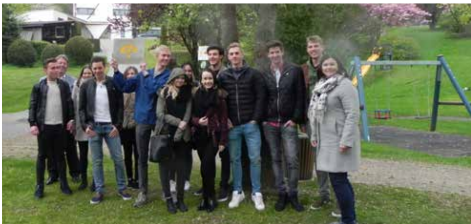
Die Jungbürger 1998/1999 mit der Jahrgangstafel am Dorfplatz in Dörnbach

Für jeden Jungbürger gab es Gutscheine und Freikarten als Geschenk: