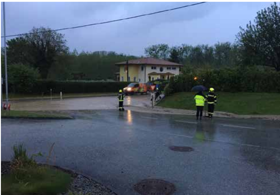
Überschwemmungen in Wilhering FF Edramsberg