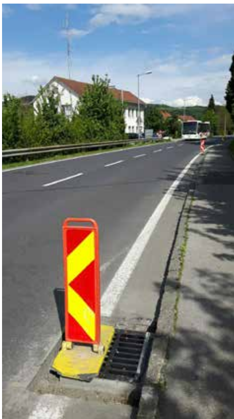
Das Kanalsystem der B129 wird dieses Jahr saniert

Die Sanierung wird rund € 1,6 Millionen kosten. |