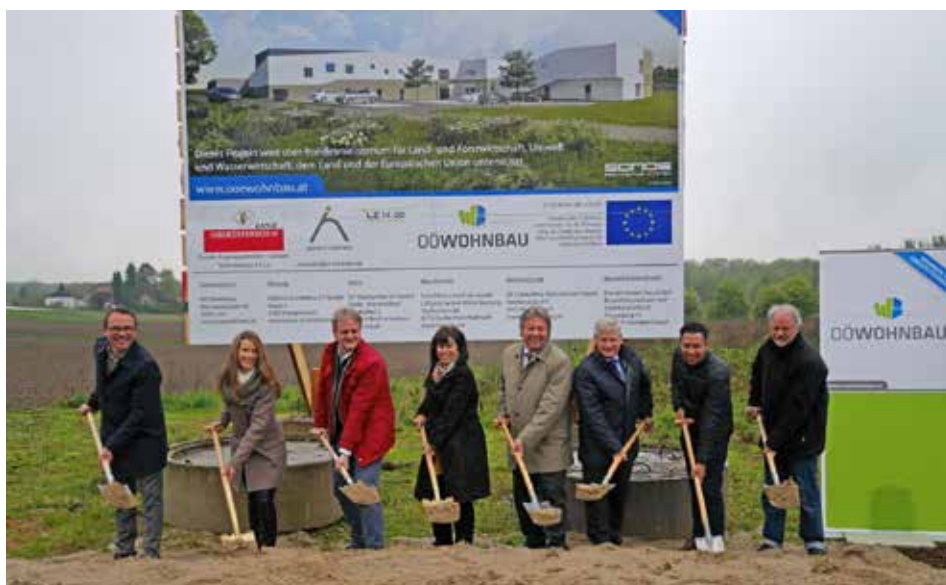
Der Spatenstich für die Außenstelle des Institutes Hartheim ist erfolgt

Die Außenstelle in Wilhering ist ein weiterer Schritt auf dem Weg der Inklusion. Dies meint, dass Menschen