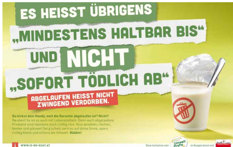
"Is nu guat"-Kampagne gegen Lebensmittel im Abfall