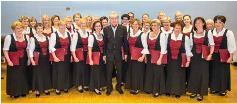
Der Singkreis lädt herzlich zum Festkonzert am 10. & 11. Juni!

Nun ist es bald soweit, unser Konzert zum 30-jährigen Jubiläum steht vor der Tür. Die Aufregung steigt. Wir möchten unsere Zuhörer mit den beliebtesten Liedern aus diesen drei Jahrzehnten verwöhnen. Angesichts der großen Bandbreite fiel die Auswahl nicht leicht, es gibt einfach so viele schöne Melodien. Doch wie