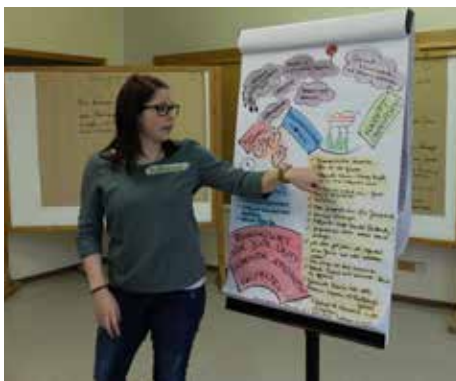
Es werden Vorschläge erarbeitet und präsentiert

In einer Präsentationsveranstaltung stellen die Jugendräte ihre Ideen der Öffentlichkeit vor und entwickeln