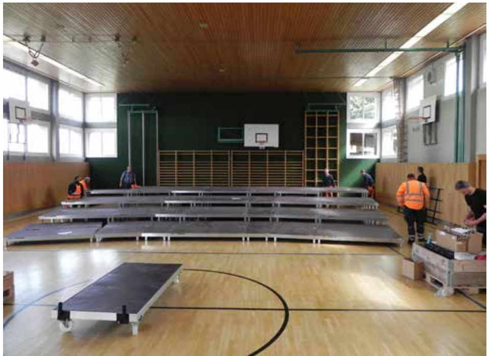
Bauhofmitarbeiter und Helfer der Musikvereine beim Probeaufbau der Bühne

Beim Frühjahrskonzert des Musikvereines Schönering erlebte die Bühne ihre Premiere. |