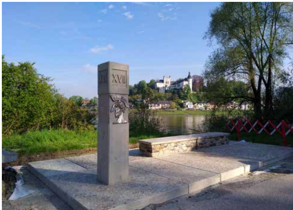
Der Römerrastplatz wurde im Mai errichtet. Dieser steht für eine gute Rast zur Verfügung.