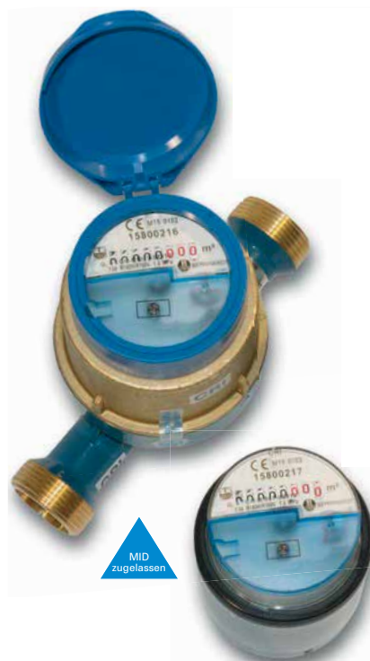
Die neuen Funkwasserzähler werden ab heuer eingebaut

eigentümer versendet werden. Dank der Funkwasserzähler können eventuelle Leckagen im