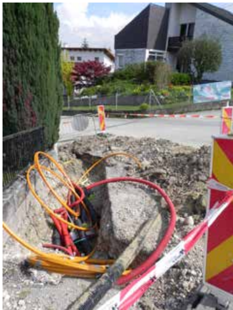
Glasfaserkabellegung in Thalham

Laut Breitbandkataster des Landes OÖ ist die Gemeinde Wilhering bereits sehr gut mit Breitband, sprich Glasfaserkabel, angebunden. Hauptgrund ist das Angebot der Firma Höllerl mit 24speed.at.