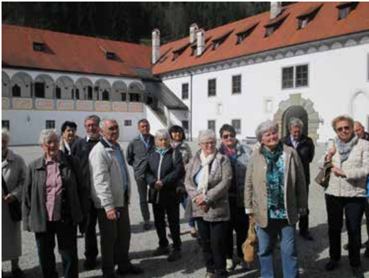
Senioren Ausflug nach Ybbsitz