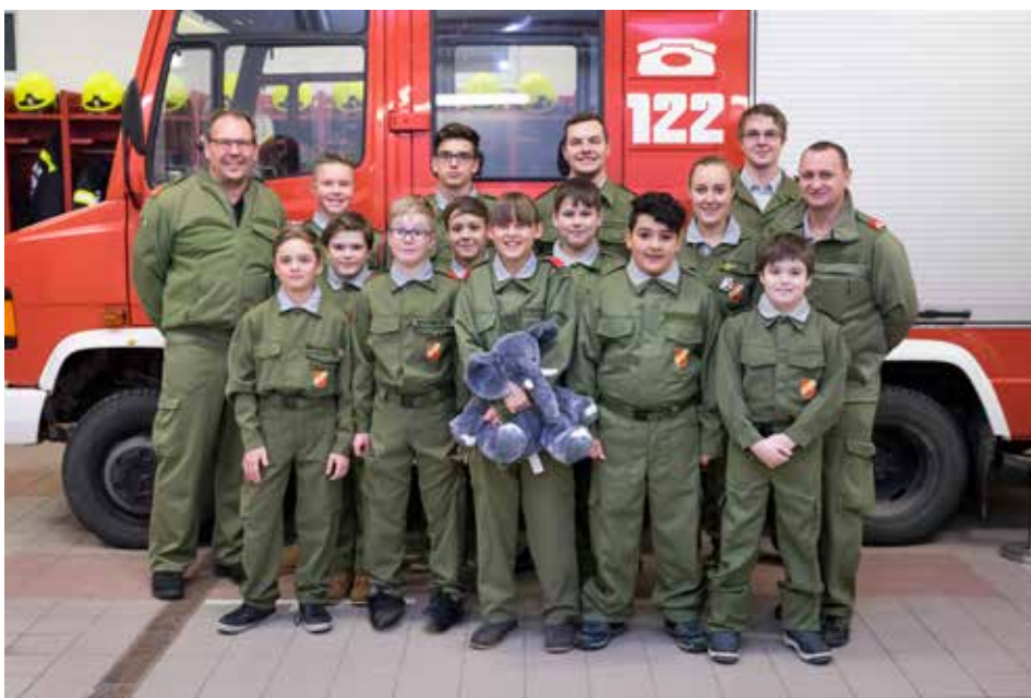
Die Jugendgruppe der FF Schönering

Wir freuen uns über jeden Neuzugang, ob Jungfeuerwehrmitglied oder Aktive.