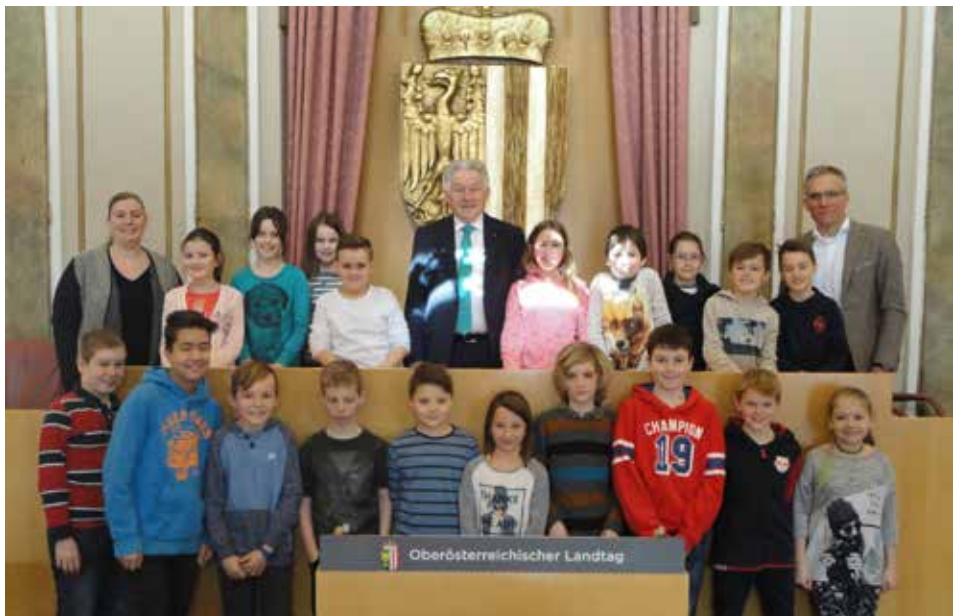
Dr. Josef Pühringer begrüßte die Schüler im Landhaus

Im Landtagsitzungssaal wurden wir fotografiert und bekamen noch weitere Informationen über das Landhaus.