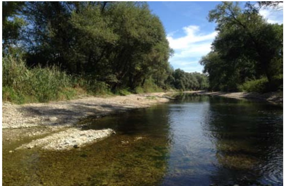
Erste fertiggestellten Kiesstrukturen am Innbach