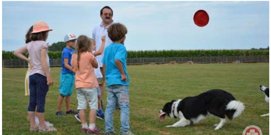
Kinder fanden gefallen an den Rettungshunden.

Seniorentanzen beginnt wieder am Dienstag, den 22.09.2015 um 09:30 Uhr.