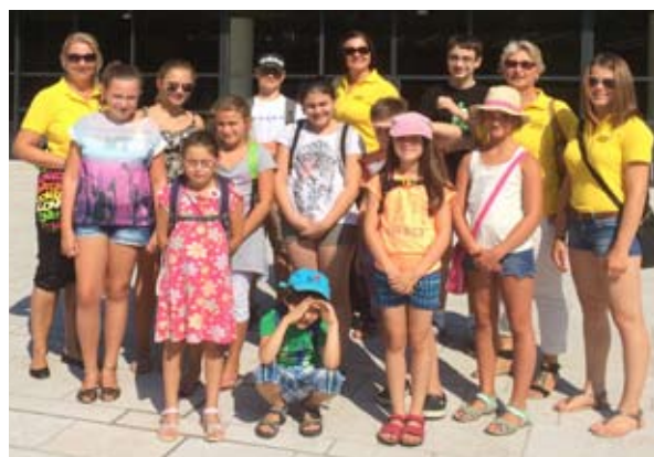
Führung durch das Musiktheater