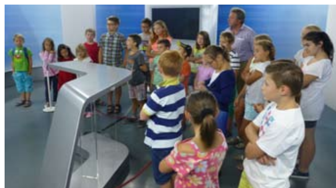
Wir besuchen den ORF