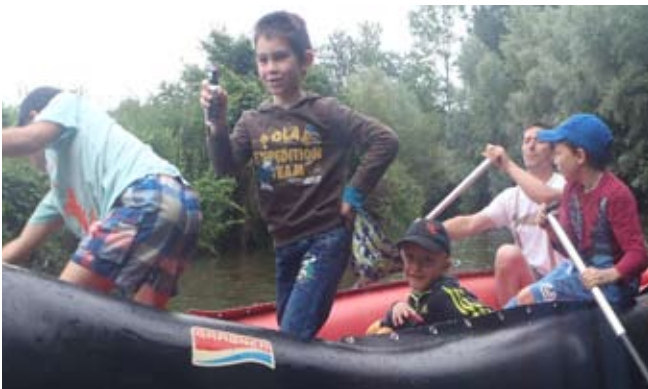
Bootsafari auf der Aschach