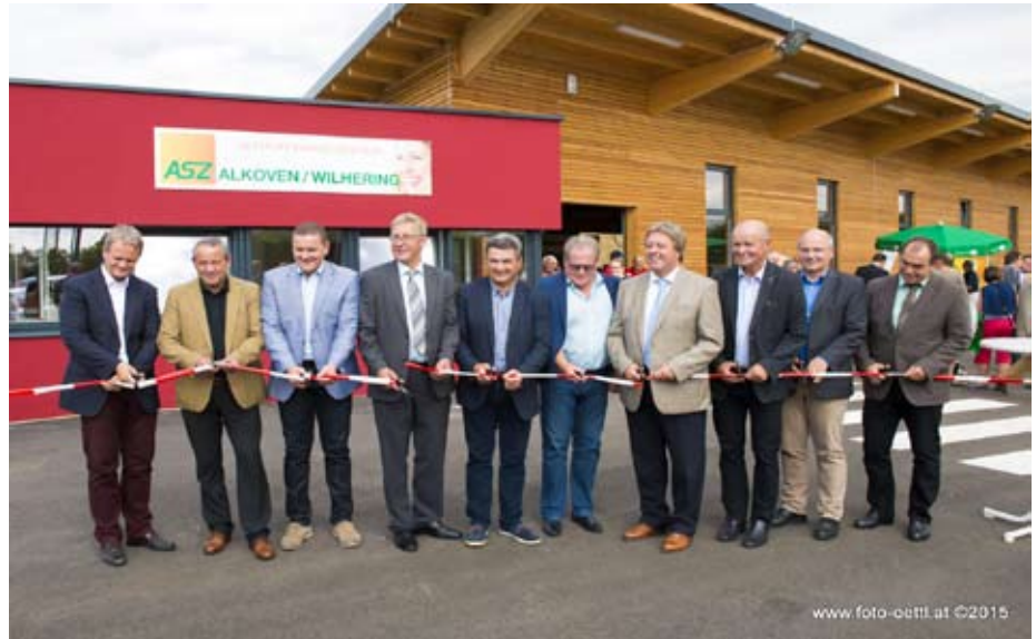
Das ASZ Alkoven-Wilhering wird feierlich eröffnet