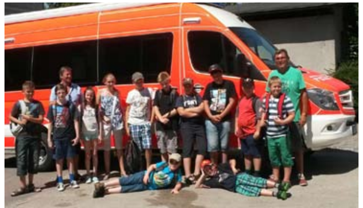
Besuch bei der Berufsfeuerwehr