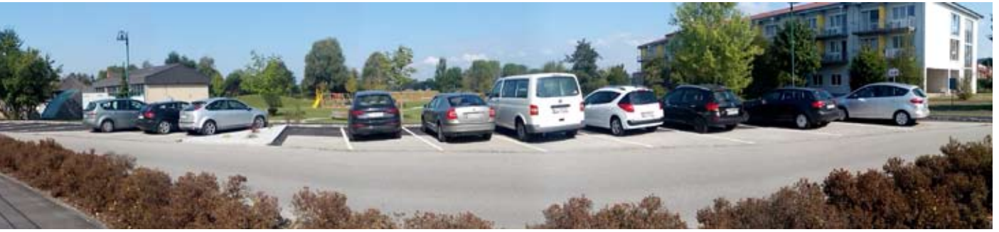
Rundumblick im Zentrumsbereich Schönering. Neue Parkplätze wurden geschaffen.

und mit dem bestehenden Angebot zufrieden sind. Abschließend möchte ich mich vor den Gemeinderats- und BürgermeisterInnenwahlen bei allen Kolleginnen und Kollegen im Gemeindevorstand und Ge-