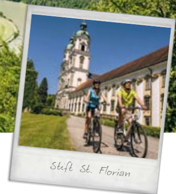
Stift St. Florian

WGD Donau Oberösterreich Tourismus GmbH +43 732 7277-800 www.donauregion.at