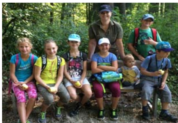
Geocaching - Die moderne Schatzsuche