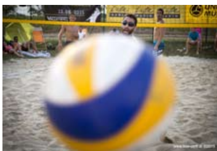
Unser Beachsommer 2015 perfekt getroffen!

Der Sommer 2015 ist zu Ende und es war nicht nur in Sachen Temperaturen war es ein heißer Sommer auf der Beachvolleyball-Anlage Schönering, denn heuer gab es gleich zwei Top-Highlights neben der Ferienpassaktion Beacholympiade und einem kleinen aber feinen Turnier veranstaltet durch JVP. Vor allem beim Beach'n Grill am 4. Juli kämpften die Teams bei 36 Grad um die Punkte und gegen die Hitze. Das Turnier wurde im Rahmen der neu gegründeten Turnierserie – dem OÖ Beachcup – gespielt, der neben Schönering auch noch in Grieskirchen, Ried im Traunkreis, Attnang-Puchheim und Gallspach gastierte. Bei jedem Turnier sammelten die TeilnehmerInnen Punkte für ihre Platzierung, beim Beachcup-Finale in Gallspach wurden dann die GesamtsiegerInnen prämiert! Mit insgesamt über 250