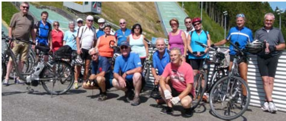
Die Radfahrer bei der Skisprungschanze Hinzenbach

Gerade, als sich die Teilnehmer des Radausfluges auf den Weg zum Treffpunkt machten, begann es leicht zu regnen. Für einige Grund genug, lieber zu Hause zu bleiben. Trotzdem machten sich noch neunzehn Biker auf den Weg und erlebten einen äußerst gemütlichen Ausflug bei herrlichem „Radlerwetter“. Vom Kraftwerksparkplatz ging es über Goldwörth, Feldkirchen und Aschach bis nach Hinzenbach, wo wir die Skisprunganlage besichtigten. Zu Mittag gab es eine Stärkung im Lindenhof. Weiter ging die Fahrt über Fraham und Inn bis zur nächsten Rast im Gasthaus „Gelsenwirt“. Der letzte Teil der Strecke, insgesamt waren es gut 50 km, führte über Alkoven und Schönering direkt zum Beachvolleyplatz, wo wieder das diesjährige Beachturnier