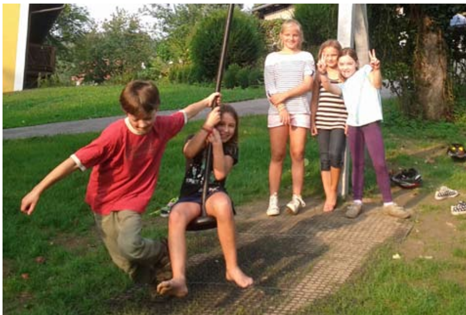
Kinder erfreuen sich an der Spielplatz-Erweiterung in Dörnbach.