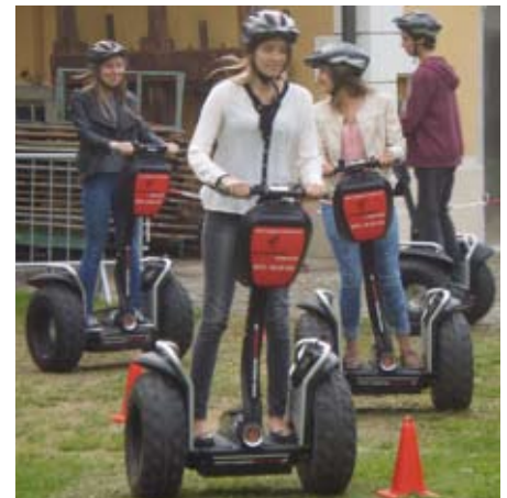
Mit „Youth in Action“ Segway fahren!

akademie abgehalten wurde, wurden auch bereits einige Anregungen umgesetzt, wie z. B. eine weitere Fahrt des AST-Taxis und einen Shuttledienst nach Linz an Freitagen und Samstagen bzw. vor Feiertagen. Informationen dazu finden Sie auf der Gemeinde-Homepage.