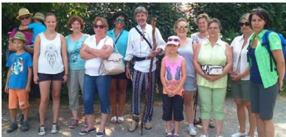
Die Ortsbauern auf den Spuren der Vergangenheit.

Die Wilheringer Bäuerinnen wanderten mit dem keltischen Druiden Tiran beginnend beim Spitzwirt zu den magischen Eichen im Forst. Sie lauschten seinen Geschichten und erfuhren Geheimnisse aus der Zeit unserer Vorfahren und nahmen teil an einem Ritual. Mit keltisch-römischen Geschichten zurück in die Zeit vor 2000 Jahren, Gesängen und jede Menge Spaß ließ der „Druide“ Krexhammer die Zeit wie im Flug vergehen.