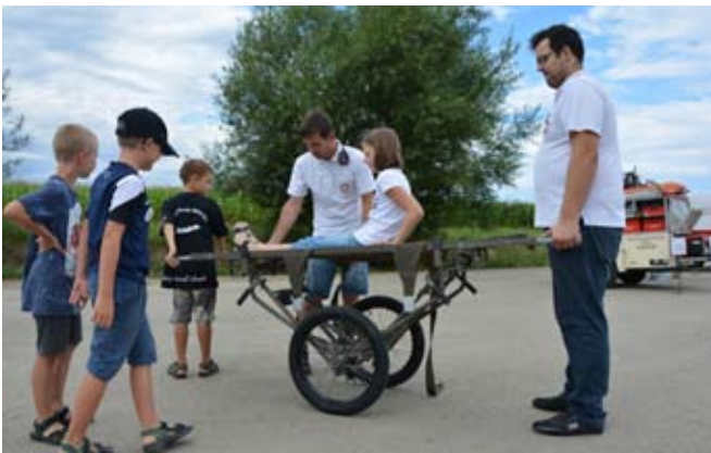
Ein Tag als Rettungssanitäter