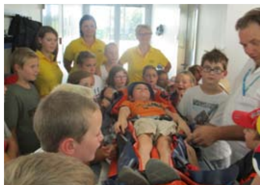
Keine Angst vorm Krankenhaus (UKH)