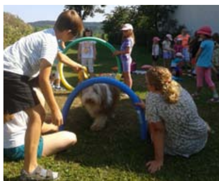
Rund um den Hund