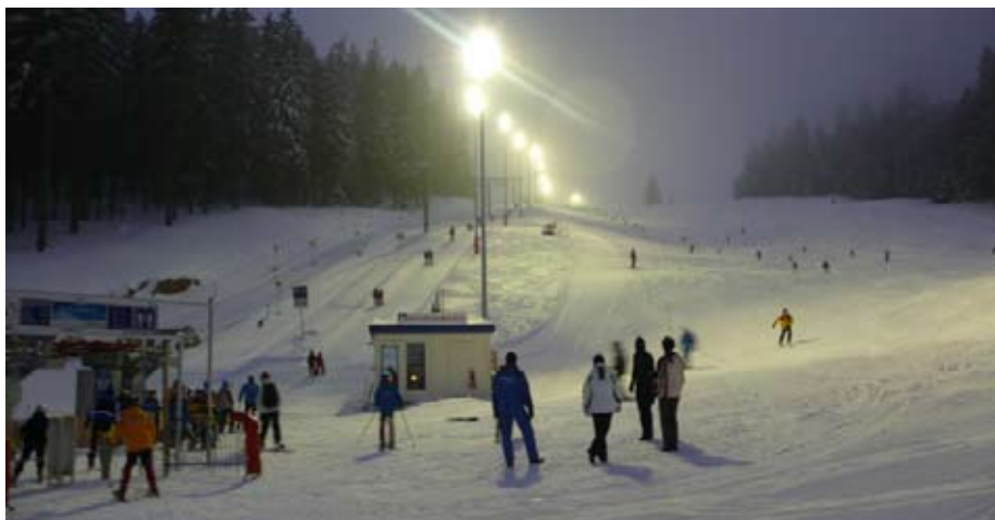
Night-Race am Hochficht

Saisonhighlight: Night-Race am Hochficht!