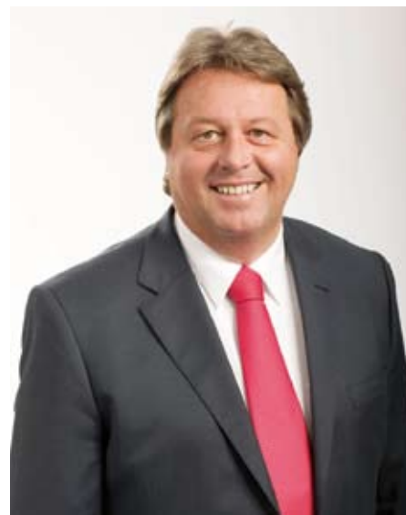
Bürgermeister Mario Mühlböck

In Schönering haben wir über den Sommer die Anzahl der Parkplätze im Zentrumsbereich deutlich gehoben: Vor der Volksschule wurden 16 Parkplätze geschaffen und vor dem Hauptschulturnsaal gibt es ebenfalls neue Parkplätze. Ich möchte aber auch deutlich zum Ausdruck bringen, dass in Ortszentren nicht die Parkplätze überwiegen sollen. Es gibt so viele Gemeinden, die das auch umkehren und die Autos aus den Zentren drängen. Nicht überall kann man zur Schule oder Kirche bis vor die Haustüre fahren. Zum Beispiel in Bad Leonfelden, in Eferding und anderen Gemeinden gibt es Parkflächen hinter oder neben dem Ortszentrum und die Leute gehen ein paar Schritte. Wir haben auch einen großen öffentlichen Parkplatz auch hinter der Stocksporthalle. Ich treffe auch auf viele Menschen, die das genauso sehen