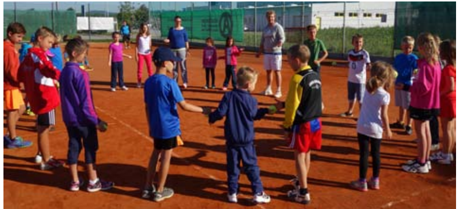
Tennis ist bei Kindern und Jugendlichen sehr beliebt.

Im Juli fand auf der Tennisanlage in Edramsberg ein Tenniscamp statt. Am Freitag konnten 35 Kinder bei einem Stationsbetrieb ihre Geschicklichkeit mit dem kleinen gelben Ball unter Beweis stellen. Im Anschluss wurde bei einem gemütlichen Lagerfeuer der Ferienstart gefeiert. Nach einem ausgiebigen Frühstück am nächsten Tag in der Tenniskantine wurden nochmals zwei Trainingseinheiten gehalten. In der ersten Ferienwoche freuten wir uns ebenfalls über eine große Teilneh-