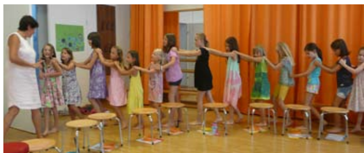
Hits for Kids