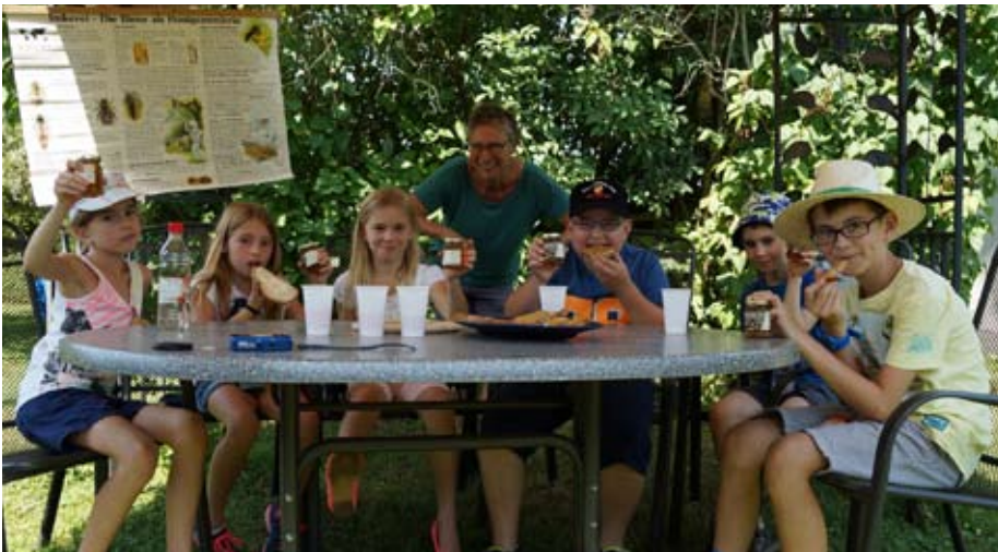
Die Nachwuchsimker stärken sich nach getaner Arbeit mit dem selbstgewonnenen Honig.

Bei der diesjährigen Kinderferienpassveranstaltung des örtlichen Imkervereins nahmen sechs äußerst interessierte Kinder teil. Es gab Gelegenheit, einen Blick in ein Bienenvolk zu werfen, Honigwaben zu entdecken und danach zu schleudern. Anschließend wurde der frische Honig in Gläser gefüllt und mit nach Hause genommen. Ausnahmslos waren alle