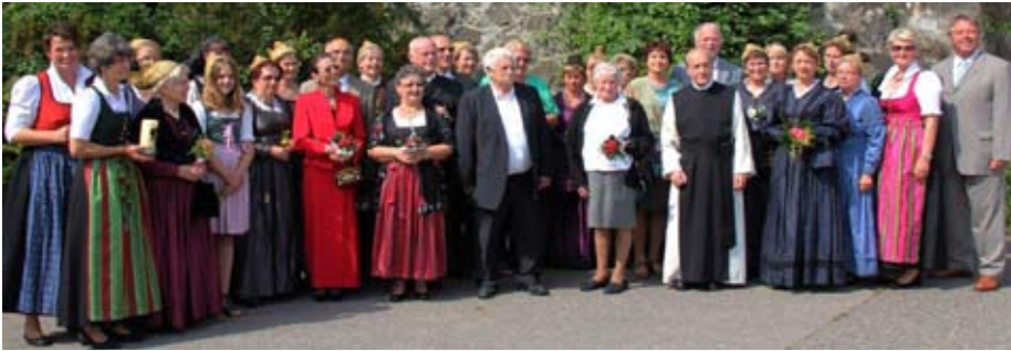
Die Goldhauben mit den Jubelpaaren

Am 14. Juni 2015 feierten die Goldhaubengruppen mit den Paaren das Jubiläum in der Stiftskirche Wilhering.