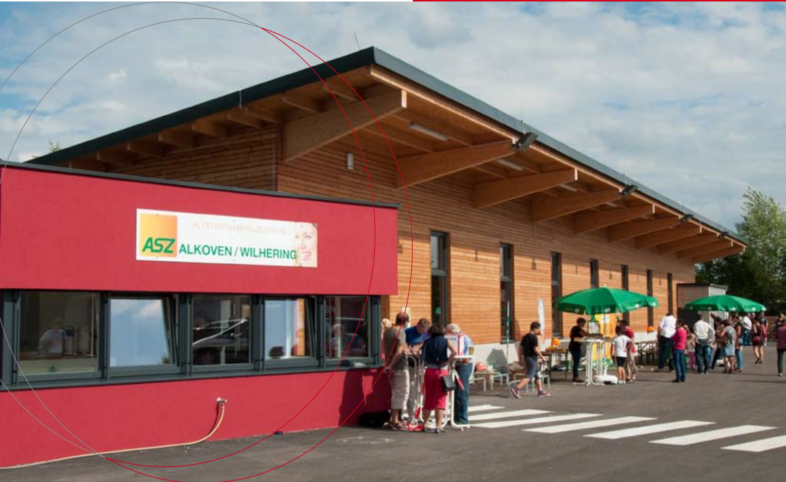
Altstoffsammelzentrum mit Grün- und Strauchschnittabgabe