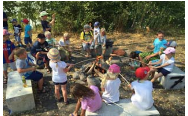
Piratenspiele an der Donau