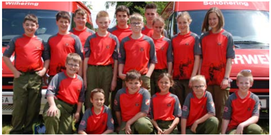
Die Jugendgruppe beim Leistungsbewerb

Auch im heurigen Jahr war der Besuch bei den Feuerwehren Edramsberg, Schönering und Wilhering wieder ein Fixpunkt im Wilheringer Ferienpass. Mit dabei waren natürlich auch die Mitglieder unserer Jugendgruppe. Nach der Begrüßung durch den Pflichtbereichskommandant HBI