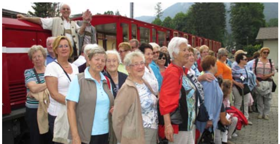
Der Seniorenbund war mit der Schafbergbahn unterwegs.

Das Seniorenturnen startet am Mittwoch, den 23.09.2015 um 16:30 Uhr.