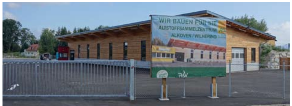
Das neue bezirks- und gemeindeübergreifende ASZ Alkoven/Wilhering hat den Betrieb aufgenommen. Damit haben Sie mit den neuen Öffnungszeiten und der modernen Anlage verbesserte Möglichkeiten bei der Entsorgung von Alt- und Problemstoffen.

Aber auch sonst gibt es Vieles zu berichten. Bei der vergangenen Sitzung des Umweltausschusses wurde die Ausweitung des AST-Angebotes beraten und so beschlossen. Weitere Nachfahrten von Linz nach Wilhering und zwei Abfahrten von Wilhering nach Linz werden das Angebot erweitern. Die Fahrpläne der WILIA