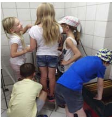
Ein Besuch beim Imker