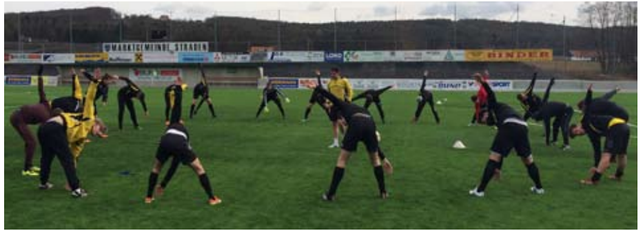
Traumbedingungen beim Trainingslager

Der desolate Zustand unseres Trainingsplatzes machte die Beauftragung einer Sanierung nötig. Im Herbst mussten eine Vielzahl an Trainings abgesagt oder woanders abgehalten werden, ein untragbarer Zustand. Sobald es das Wetter zulässt, wird mit den Arbeiten begonnen. Es werden neue Drainagen eingezogen und einige andere Maßnahmen gesetzt, um zumindest ab Ende Mai/Anfang Juni wieder ordentliche Bedingungen zu haben. Als Erstes wurden bereits im Winter die hohen Bäume entlang des Hauptfeldes entfernt, damit