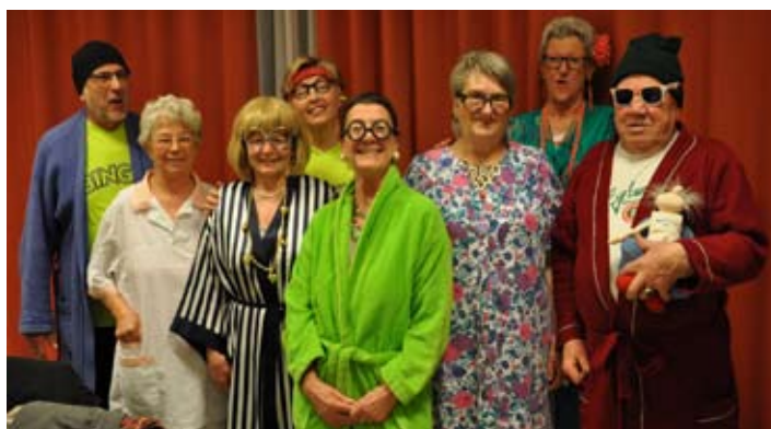
Die Mitglieder des Seniorenbundes als Theatergruppe