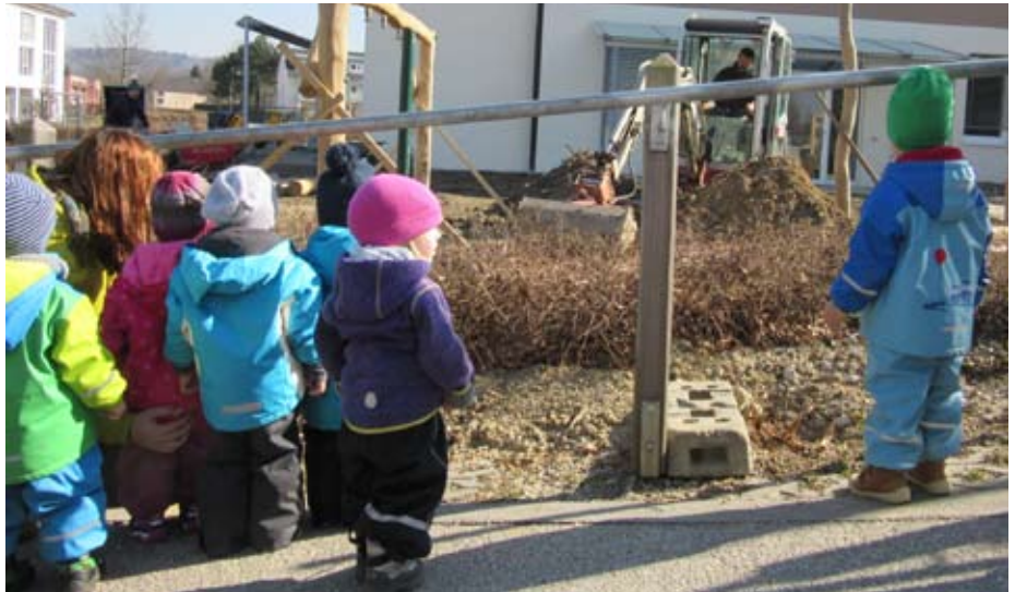
Spaziergang zur Baustelle