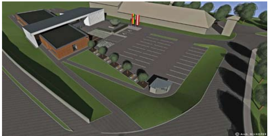
Ansichten des neuen Gemeindeamtes Architekten Gilhofer

Diese Zeitung dürfte fast zeitgleich mit der Segnung und dem Tag der offenen Tür der WILLA-Garage erscheinen. Daher möchte ich Sie alle noch einmal für den 17.04.2015 in der Zeit von 13.00 bis 17.00 Uhr recht herzlich zur WILLA-Garage an der Mühlbachkreuzung einladen. Neben der Vorstellung des neuen WILLA Gebäudes, sehen Sie eine Ausstellung „WILLA von einst bis heute“, natürlich die modernen Busse uvm. Es gibt eine Stärkung und gemütliches Beisammensein.