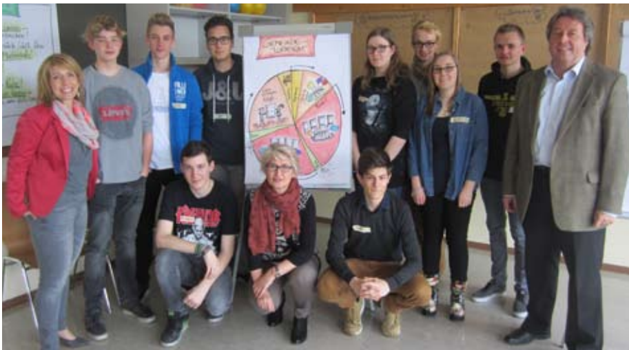
Zahlreiche Jugendliche nahmen am Jugendrat im März teil!