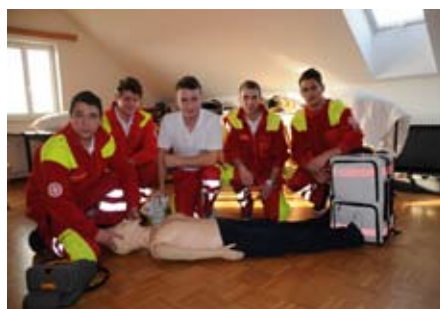
Zivildienster bei Schulung

Herzlichen Dank allen MitarbeiterInnen für die geleisteten Stunden.