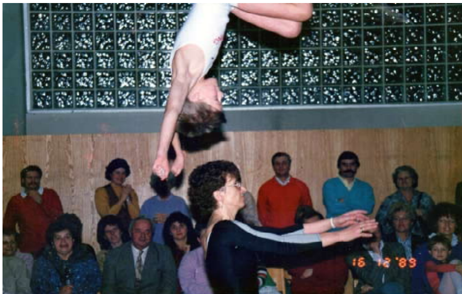
Das erste Schauturnen 1989

Nun beginnt die Zeit der Meisterschaften. Unser Ziel ist es, gut abzuschneiden. Einige versuchen sich bereits in der Oberstufe.