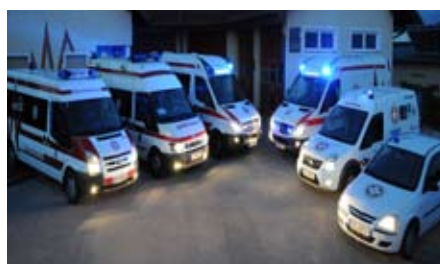
Unserer aktueller Fuhrpark