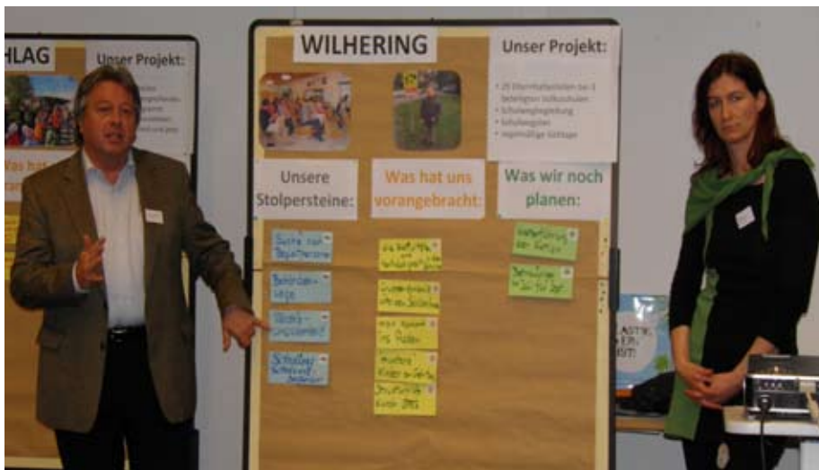
Vorstellung des Pilotprojektes „Aktion Sicherer Schulweg“ mit der SPES Akademie

mal wurden die notwendigen Holzarbeiten erledigt. Im Sommer soll dann dort ebenfalls mit dem Rückbau der Regulierung begonnen werden. Solche Maßnahmen bringen Verbesserungen bei Hochwässern und vor allem verbesserten Lebensraum für die Tiere. Der beliebte Weg zwischen Schönering und der „Alten Landstraße“ bleibt erhalten, wird jedoch dort oder da schmaler als bisher.