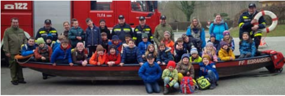
Die VS Schönering zu Besuch bei der Feuerwehr