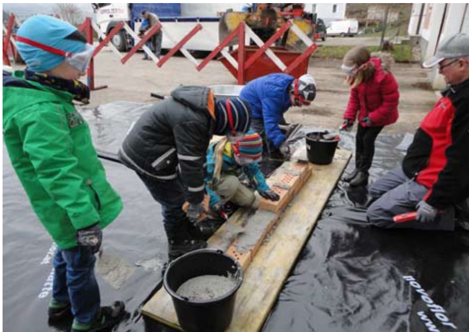
Die Kinder der VS Wilhering arbeiten fleißig.