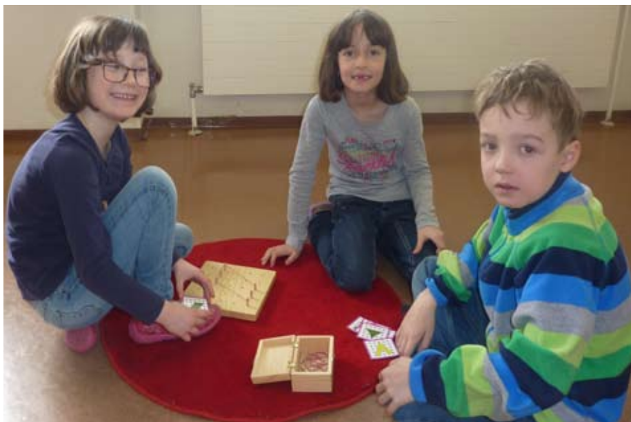
Kindergartenkinder erkunden die Schule!

An dieser Stelle ein großes Danke an die Kindergartenpädagoginnen der beiden Kindergärten für die gute und positive Zusammenarbeit! Eine Vernetzung beider Institutionen ist von wesentlichem Wert und wirkt sich nur positiv auf den Schuleintritt aus.