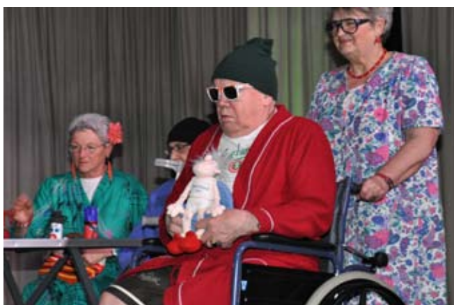
Der Seniorenbund auf der Bühne

Die bereits traditionellen Rosenmontagssitzungen der ÖVP Wilhering fanden heuer erstmals unter Beteiligung der Senioren statt. Unsere Ortsgruppe präsentierte sich mit einem selbstverfassten Sketch. Mit dem „Maibaum-flash“ vom „voxx club“ und dem Linedance „achy breaky heart“ von B. Cyrus rissen sich 8 Senioren aus ihrem scheinbaren Altersheim-Trott (Blasentee und Haferschleim) samt Rollstuhl und Schwerhörigkeit heraus und rockten die Bühne des Pfarrheimes Wilhering. Der Applaus des fröhlichen Publikums freute uns sehr, belohnte er doch die zeitaufwendigen Proben. Alt, aber noch immer in Schwung! Vielleicht will man uns öfter?