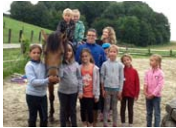
Auf dem Rücken der Pferde