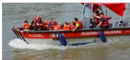
Fahrt mit dem Feuerwehrboot

von ihren Eltern abgeholt wurden, gab es noch ein Gruppenfoto beim Feuerwehrhaus.