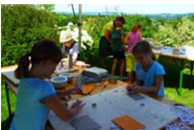
Formen mit Ton