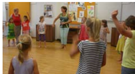
Hits for Kids