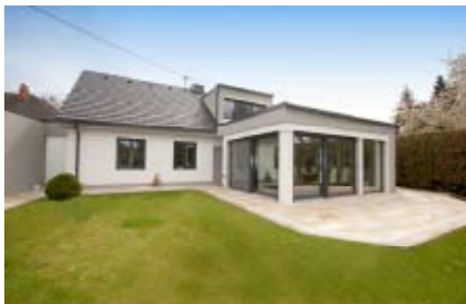
Komplettsanierung + Anbau