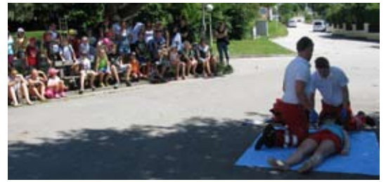
Ein Tag beim Roten Kreuz