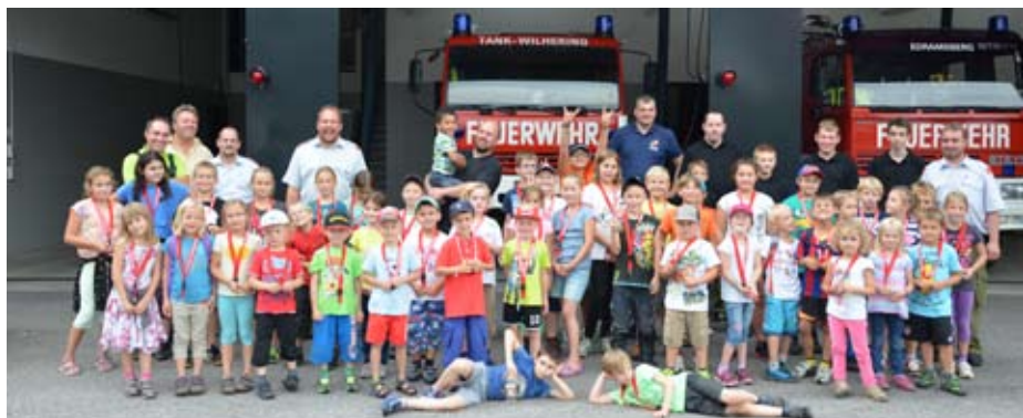
Ferienpassaktion „Besuch bei den Feuerwehren“

Der Probearm dient einerseits zur Überprüfung der technischen Einrichtungen des Warn- und Alarmsystems, andererseits soll die Bevölkerung mit diesen Signalen und ihrer Bedeutung vertraut gemacht werden.