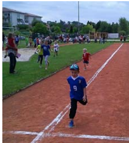
Kinder beim Sport.

Die Neue Heimat beabsichtigt dort im nächsten Jahr in zwei Bauetappen über dreißig Wohnungen zu errichten. Der Bau-