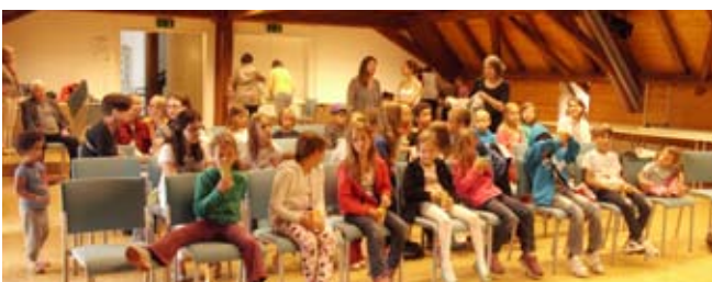
Kinderfilm „Hände weg von Mississippi“