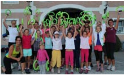
Zumba & Smovey