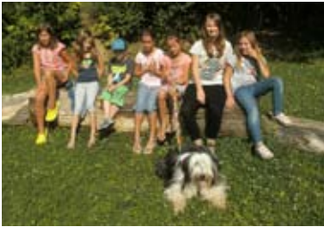
Rund um den Hund