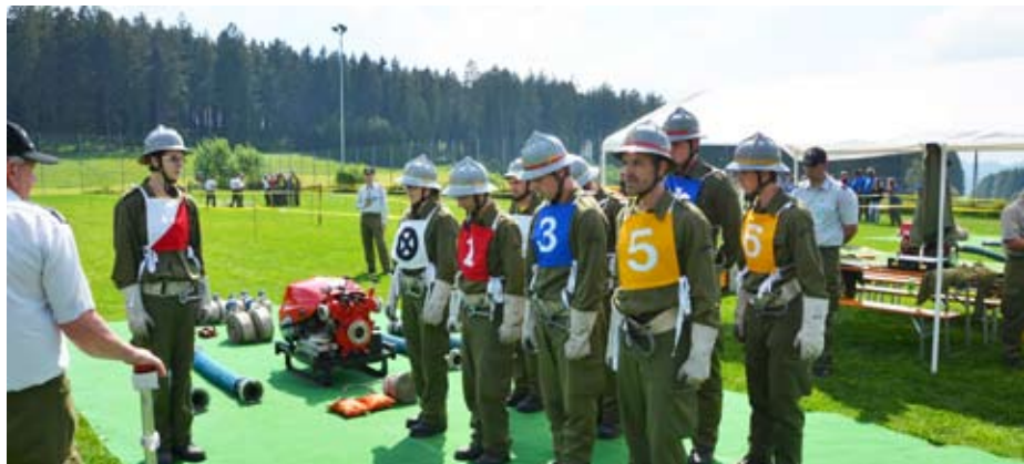
Die Bewerbungsgruppe der Feuerwehr Schönering bereitet sich auf den Start vor!

Das Kommando der Feuerwehr Schönering gratuliert zu den erbrachten Leistungen sehr herzlich.