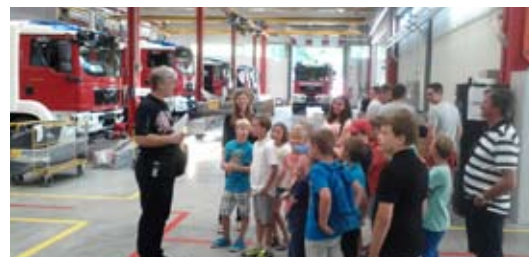
Besuch bei der Firma Rosenbauer