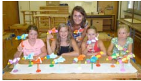
Wir basteln Zettelvögel