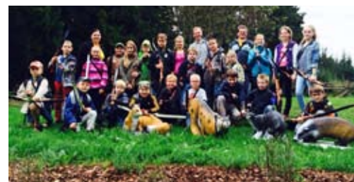
Erlebnis Bogensport in Breitenstein