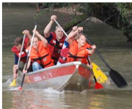
Beim Abrudern an der Donau

Mit Unterstützung des Wettergottes konnte somit am Samstagnachmittag bei der ehemaligen Schiffsanlegestelle in Ufer die Veranstaltung über die Bühne gehen. Eine im kühlen Nass der Donau gekennzeichnete Strecke musste gerudert und gestochen werden und verlangte den Teilnehmern so einiges ab.