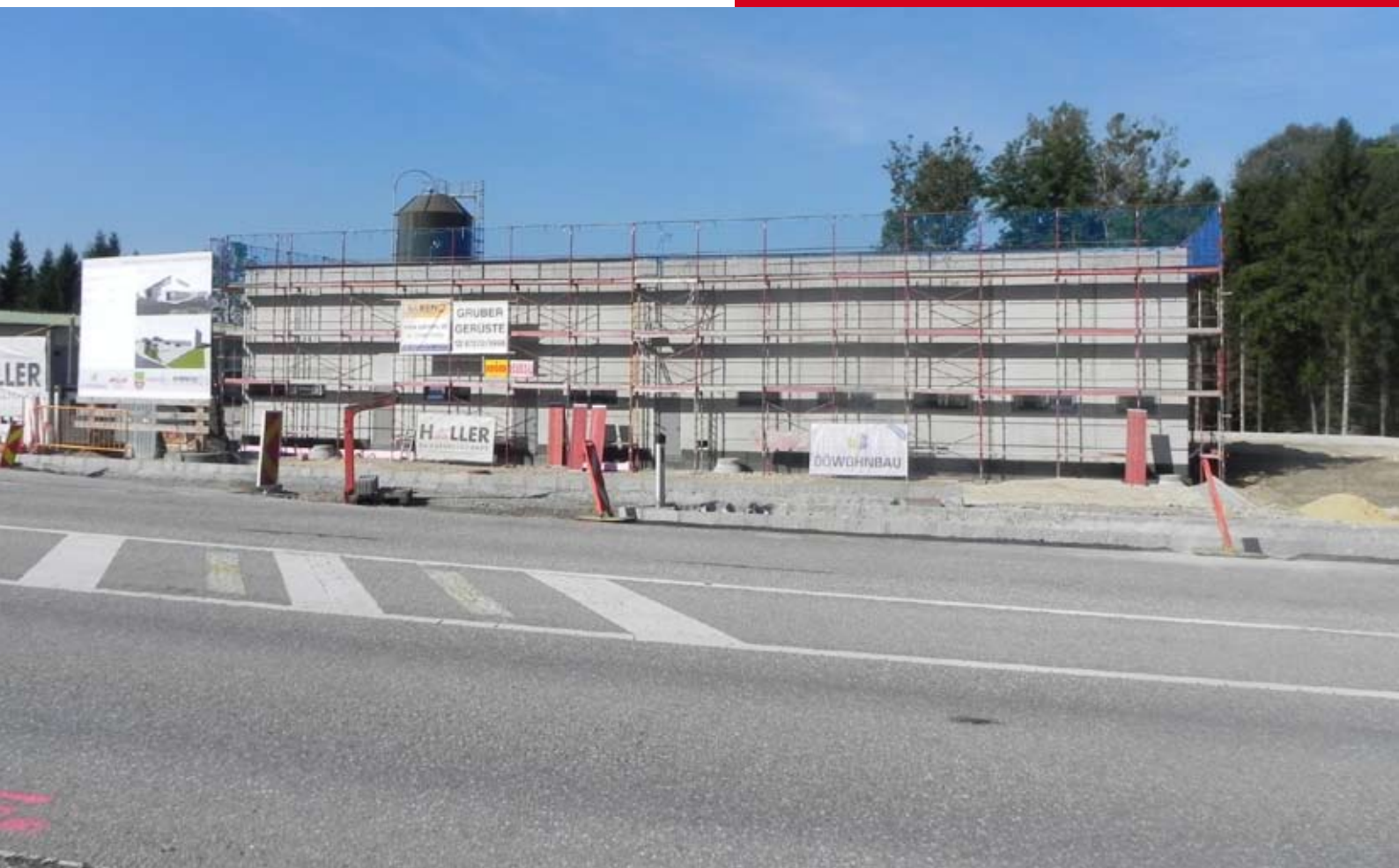
Bau der neuen WILIA-Garage