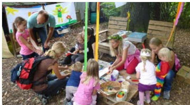
Die Feier im Waldkindergarten.

Dann wurde gefeiert: Die Mitglieder der Zeitbank 55 plus – Zeittauschbörse, organisierten Ausschank und Ausspeisung. Die Gemeinde Wilhering überbrachte ein Geldgeschenk.