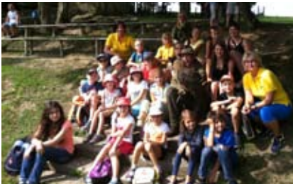
Ausflug nach Altenfelden