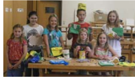
Mit Filz gestalten