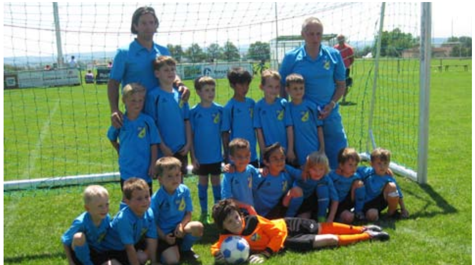
U9-Mannschaft mit Trainerteam

Auch der Nachwuchs hat bereits mit den ersten Meisterschaftsspielen die Saison 2014/2015 begonnen. Erstmals stellt der