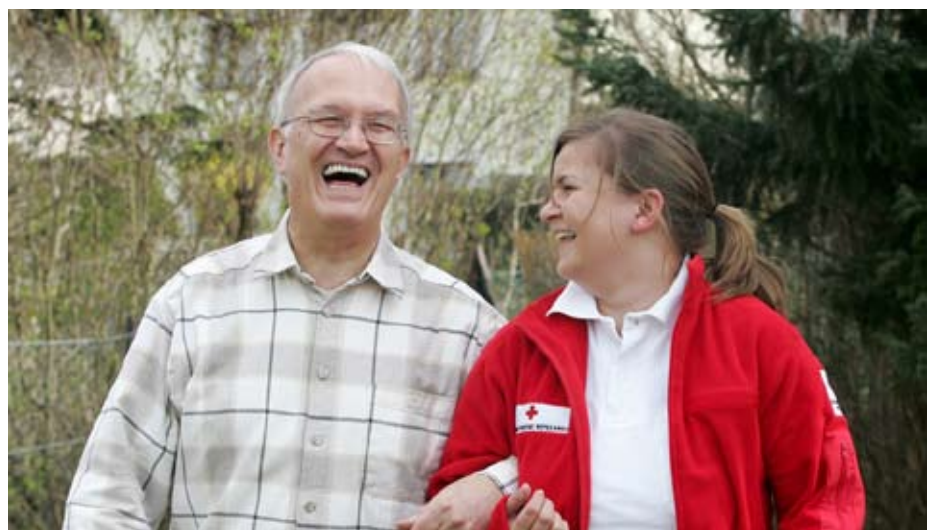
Gesundheits- und Sozialdienst