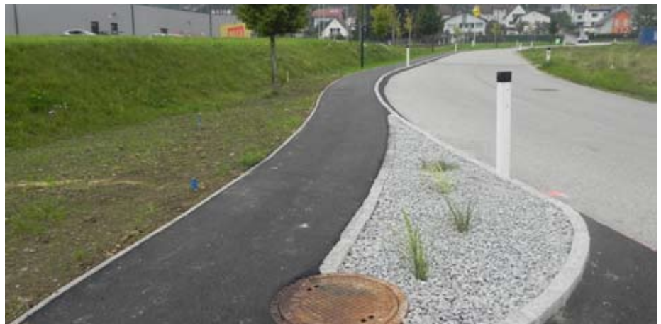
Der neue Gehsteig in Schönering.

Die Gemeinde hat dafür rund € 17.000,- aufgebracht.