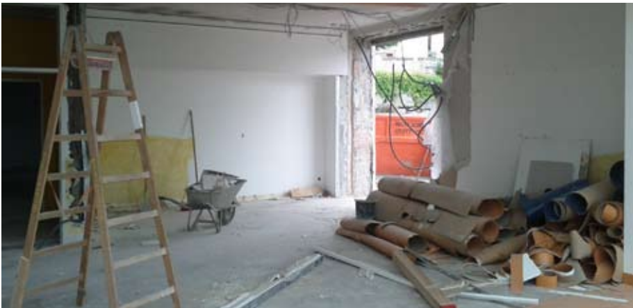
Umbauarbeiten zum Einbau der Krabbelstube in die ehemaligen Hort-Räumlichkeiten in der Volksschule Schönering.

Holen Sie sich schnell das neue Herbst/Winter Programm und buchen Sie eines der tollen Angebote.