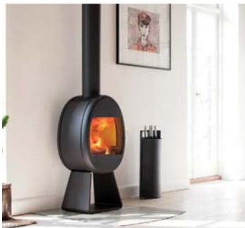
Unsere Welt des HEIZENS