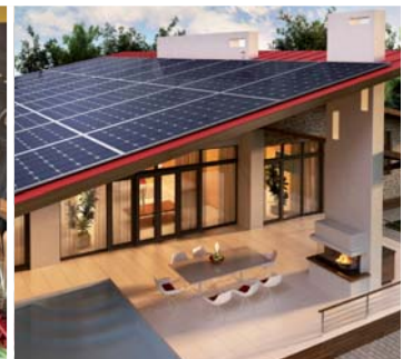
Bestens beraten bei INSTALLATIONEN