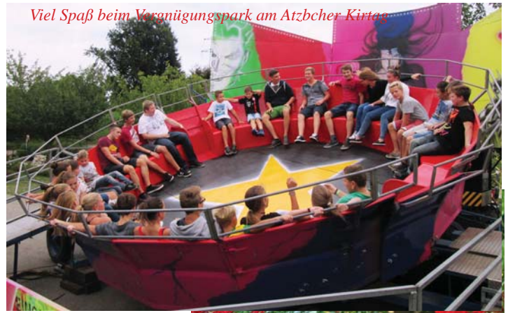
Viel Spaß beim Vergnügungspark am Atzbacher Kirtag