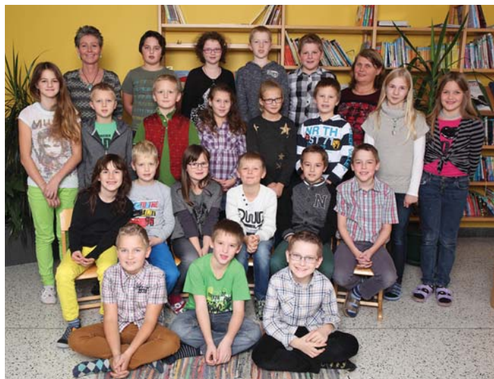
3. und 4. Schulstufe der VS Atzbach