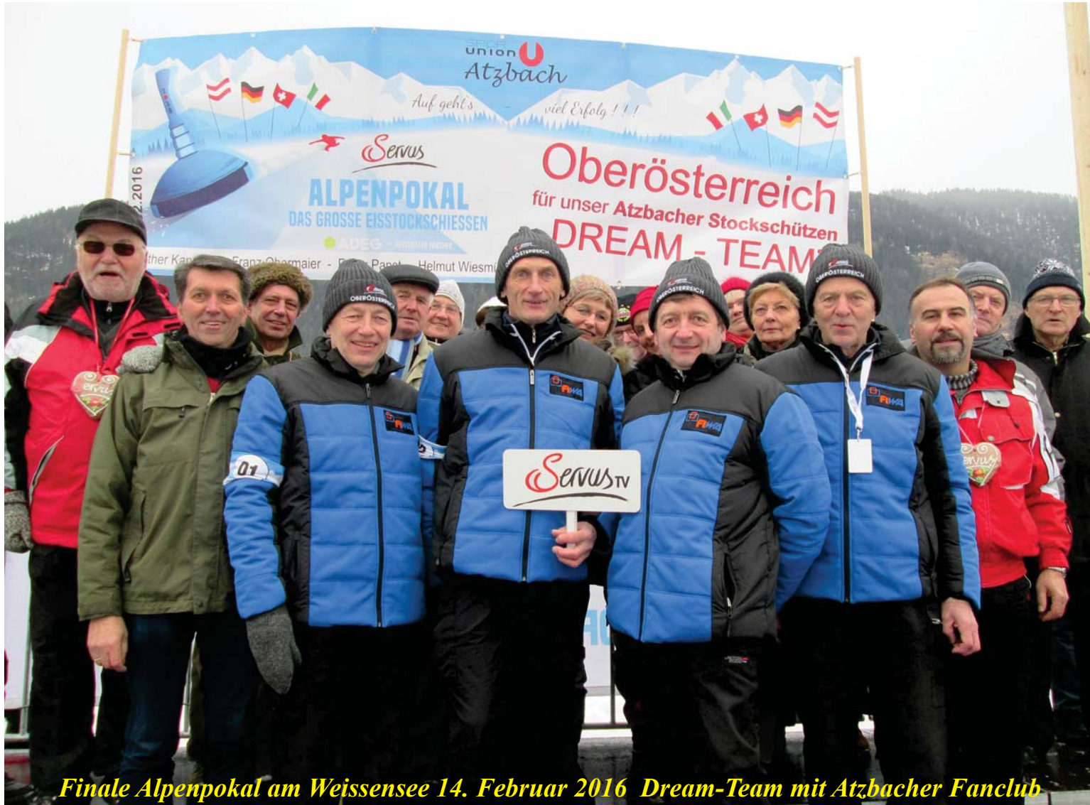
Finale Alpenpokal am Weissensee 14. Februar 2016 Dream-Team mit Atzbacher Fanclub

Amtliche Mitteilung der Gemeinde Atzbach – Nr. 1/2016 – Zugestellt durch Post.at