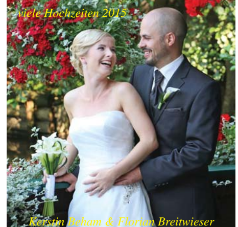
viele Hochzeiten 2015