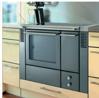
Mit allen Sinnen KOCHEN