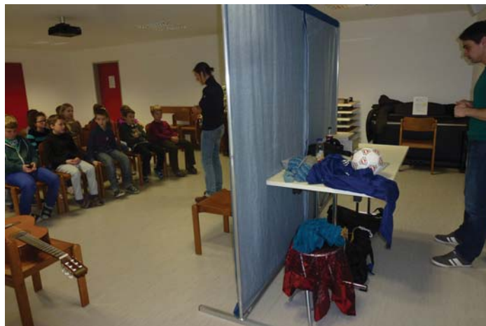
"Mein Körper gehört mir" mit den Kindern der 3. und 4. Schulstufe der VS Atzbach

Wir bedanken uns sehr herzlich bei der RAIKA Atzbach, der Gesunden Gemeinde Atzbach, der familienfreundlichen Gemeinde Atzbach sowie bei der Gemeinde Manning, die als Sponsoren dieses Projekt ermöglicht haben!