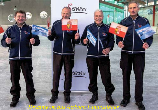
Dreamteam aus Atzbach-Landessieger