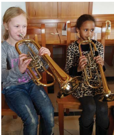
Zwei zukünftige Arienbläserinnen (in der MK sind bereits 43% weiblich)

Im Anschluss durften die Schüler und ihre Direktorin alle angebotenen Instrumente ausprobieren und dann mit dem Schlagzeug das Gebäude lautstark in Besitz nehmen.