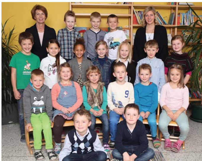
1. und 2. Schulstufe der VS Atzbach