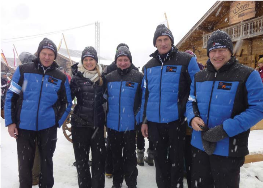
Foto zeigt das ‚Dream-Team‘ mit ihrer hübschen Betreuerin am Weissensee

Gemeinde und Union organisierten gemeinsam einen Bus, damit möglichst viele Atzbacherinnen und Atzbacher als Fans das ‚Dream-Team‘ im Finale um den Alpenpokal am Kärntner Weissensee am 14.02.2016 dabei sein konnten.