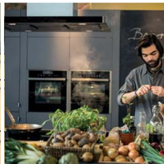
Alles rund um ELEKTRO