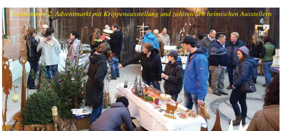
Weihnachts- 2. Adventmarkt mit Krippenausstellung und zahlreichen heimischen Ausstellern