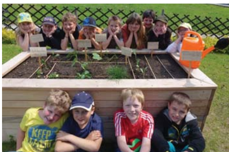
Kinder der 3. Schulstufe glücklich nach getaner Arbeit

Im Gieß- und Pflegeplan teilen sich die Kinder die Verantwortung für die Pflanzen.