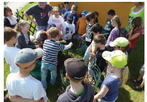
Kinder der 3. und 4. Schulstufe beim Komposthaufenbau