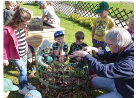
Kinder der 1. und 2. Schulstufe beim Befüllen ihres Komposthaufens