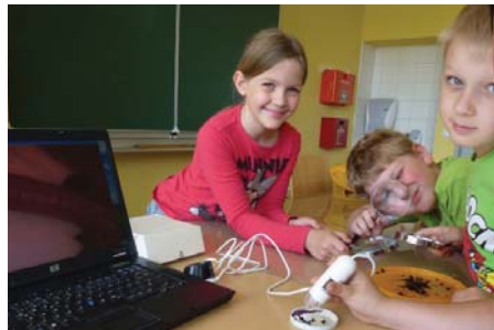
VS-Kinder der 3. Schulstufe nehmen „Schmatzi“ unter die Lupe