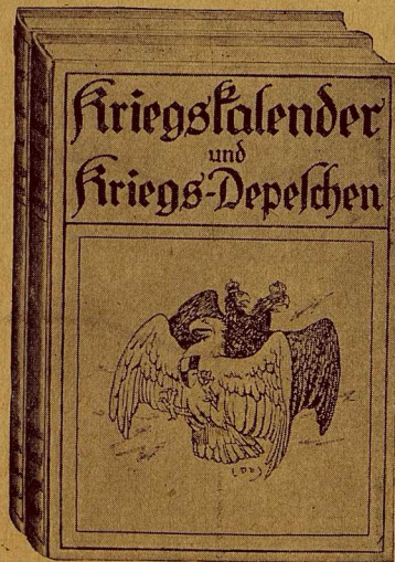
Stark verkleinerte Abbildung der Einbanddecke zu „Kriegs-Kalender u. Kriegs-Depeschen“.