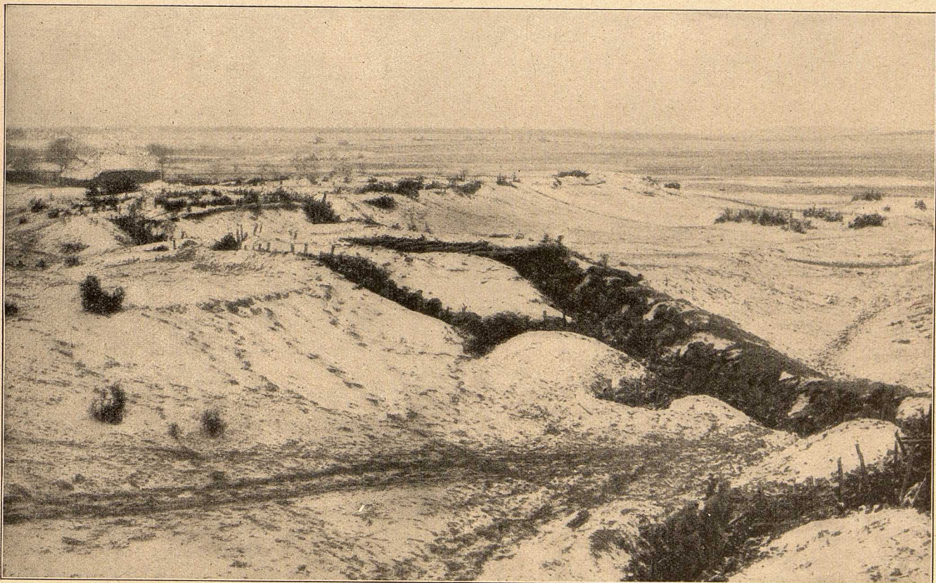
Ein Sandhügelstützpunkt der österreichisch-ungarischen Truppen in Galizien.

festgehalten. An der Paßstraße bezeichneten die beiden südlich der Paßhöhe gelegenen Ortschaften Tenzbesvölgy und Csontos die vordersten Punkte der russischen und der österreichisch-ungarischen Front. Ein Berichterstatter erzählt aus diesen Tagen: „Die an der Linie