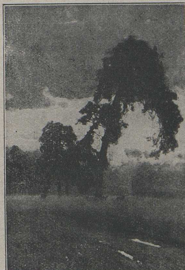
CONRAD LESSING. Abendnebel