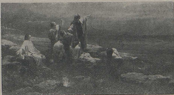
ZMURKO. Stern von Bethlehem