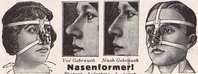
Vor Gebrauch Nach Gebrauch

Dresden, Vorbereitungs-Institut Hiss (vorm. Pollatz) Einj., Fähn., Prima, Abitur., — auch Damen. Marschnerstraße 3. — Pensionat. — Prospekt.