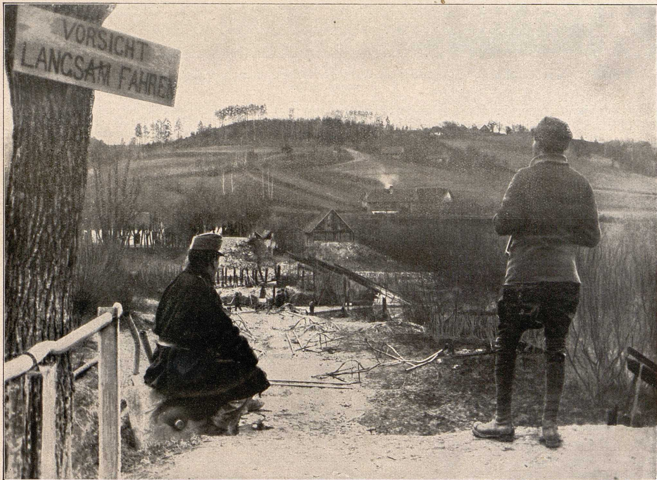
Die von den österreichisch-ungarischen Truppen gesprengte Brücke über den Dunajec bei Mt-Sandec.

Am 6. zo-gen die öster-reichisch-un-garischen Truppen auch in Kim-polung ein, und zwar, wie aus-drücklich in Berichten hinzugefügt ward, un-ter großem