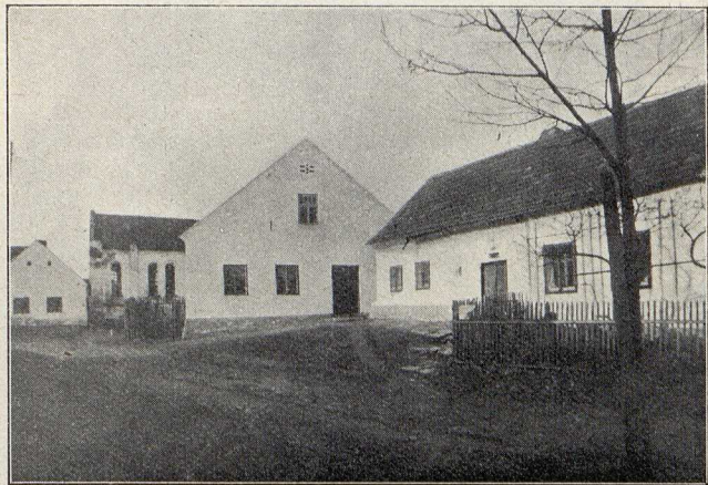
Pohled na Gheto

Z obou hraběcích resolucí je zároveň patrné, že židé byli v té době i velkým zdrojem příjmů pro vrchnost, již platili čím dál tím větší poplatek za šuc.