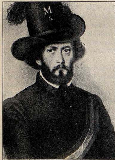
L. A. Frankl jako legionář Podle obrazů Aignerova (1849)

nost, že byli zapisováni v matrikách narozených děkanství chrastického, a to, jak jest vždy poznamenáno, na jejich vlastní žádost přede dvěma svědky. Tak