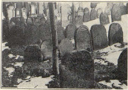
Hřbitov (stará část)