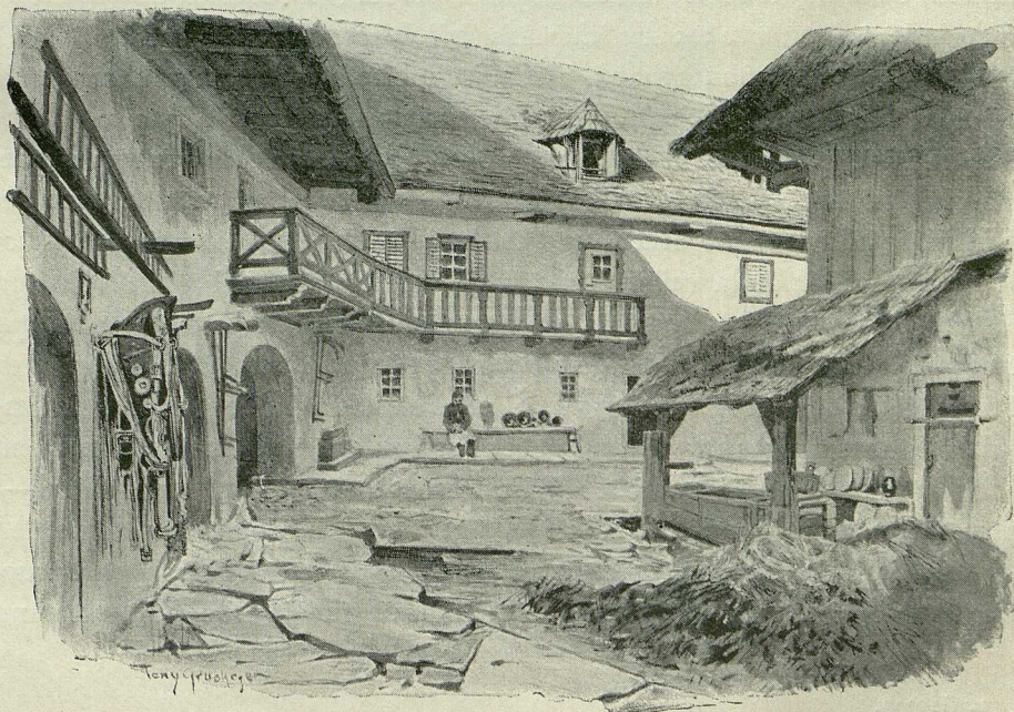
GOUR D'UNE MAISON DE CULTIVATEUR

Généralement de taille moyenne, mais souvent aussi plutôt petit, calme d'allures, et d'esprit un peu lourd mais non dépourvu de finesse, le paysan du Salzkammergut porte sur sa figure un peu austère (souvent, surtout chez les vieux, complètement rasée) l'empreinte d'un caractère sérieux, réfléchi et loyal. Les femmes, généralement blondes ou châtaines, sont assez jolies dans la jeunesse, d'une beauté douce et tranquille, aux traits un peu gros mais réguliers, avec de beaux yeux profonds où se lit