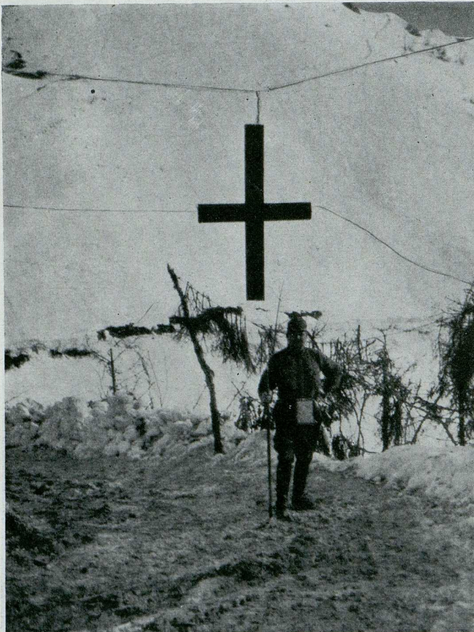
Lawinenkreuz am Passo della Vena