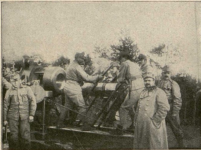
Vorstößen der Granate in den Geschößraum.

Im Hintergrunde der Kran mit Flaschenzug, um das Geschöß auf den Karren und zum Bodenstück des Mörsers zu winden.