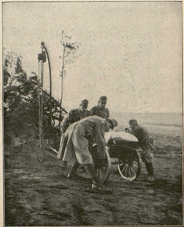
Transport der Granate.

Der Granate wird der Hebegürtel umgelegt. Sobald die Zange geschlossen ist, genügt ein leichter Zug an der Kette, das Geschöß abzuheben.