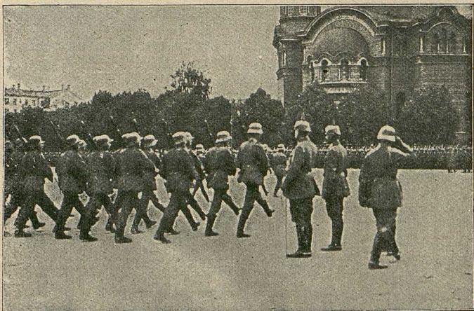
Parade deutscher Truppen vor dem Oberbefehlshaber v. Sutier auf dem Kathedraleplatz in Riga.