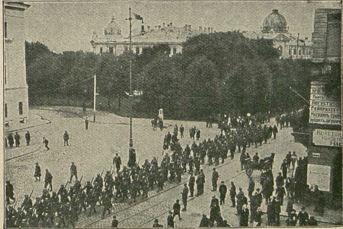
Deutsche Truppenabteilungen ziehen nach der Eroberung Rigas in die Stadt ein.