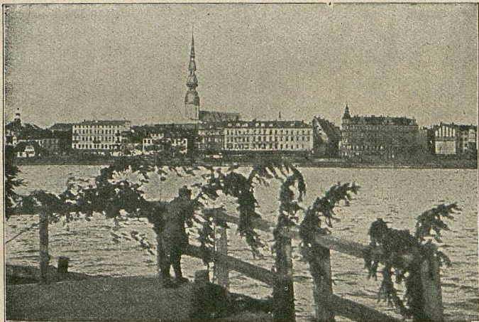
Blick auf Riga von der Düna aus.