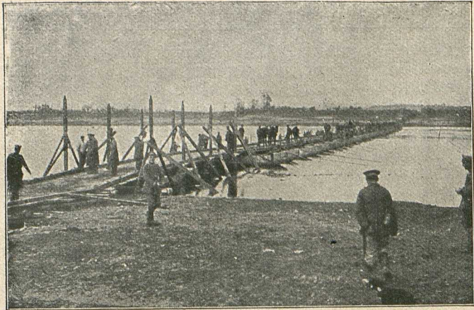
Blick auf die von den deutschen Pionieren geschlagene Dünabrücke bei Uzküll.