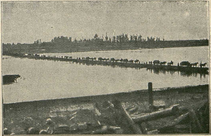
Übergang deutscher Kolonnen über die Düna bei Uzküll. Im Vordergrund verlassene russische Stellungen.