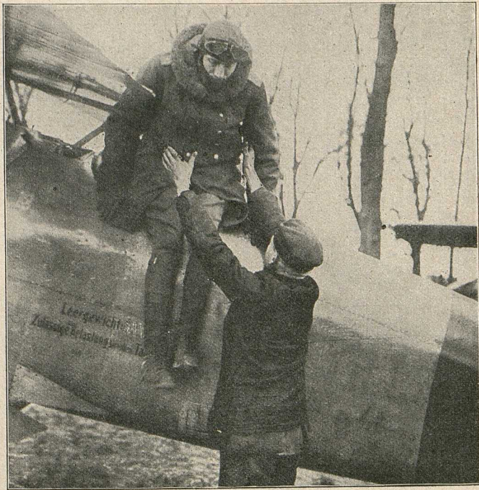
Kampfflieger Leutnant Lothar Freiherr v. Richthofen, der jüngere Bruder des Rittmeisters, kehrt von einem Fluge zurück. Bis zum 7. Mai 1917 hat er 20 Gegner zum Absturz gebracht.