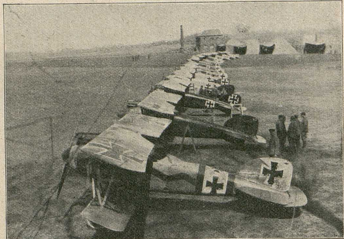
Die starzbereiten Flugzeuge der Jagdstaffel, die bis zum 22. April 1917 einhundert feindliche Flugzeuge im Luftkampfe zum Niedergehen gezwungen hat.