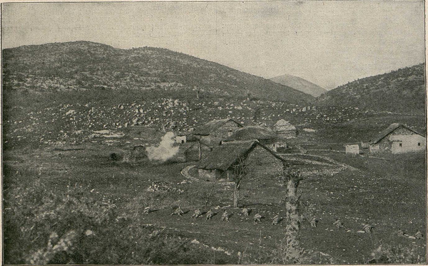
Zu den Kämpfen vor Monastir. Sächsische Jäger im Feuer.