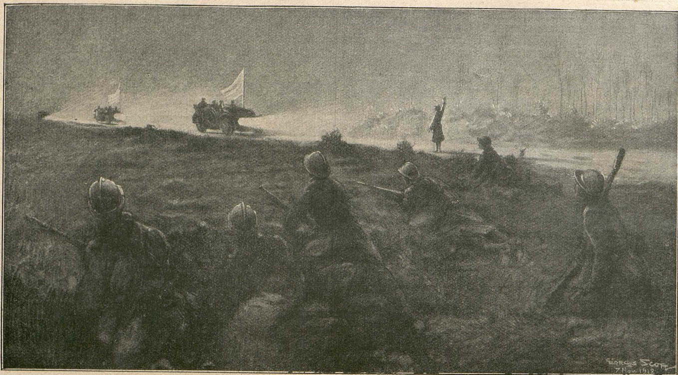
Ankunft der deutschen Bevollmächtigten zum Abschluß eines Waffenstillstandes in den ersten französischen Linien bei Haudroy auf der Straße von La Capelle nach Rocquigny am 7. November 1918. Nach einer französischen Darstellung.