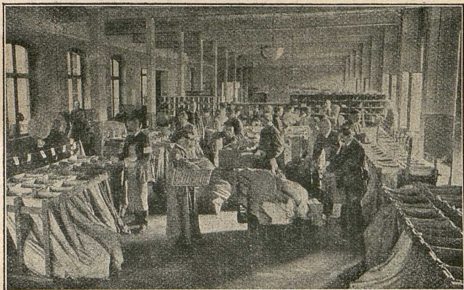
Päckchen-Feinsortierstelle „Aktive Regimenter“.

Unser Heer besteht, wie man weiß, aus vielen Tausenden von Formationen, die vielfach auch ähnlich lautende Namen tragen. Die Sendungen an diese überaus zahlreichen Einheiten