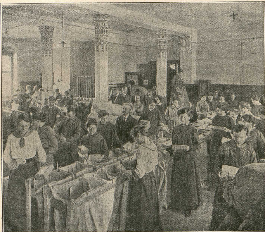
Großsortierstelle für Kolonnenformationen bei der Abteilung B im Oberpostdirektionsgebäude.

Von höchster, richtunggebender Wichtigkeit für den ganzen Betrieb ist aus militärischen Erwägungen der Grundsatz der Geheimhaltung des Systems. Diese wird auch aufs sorgfältigste gewahrt, und bei dem