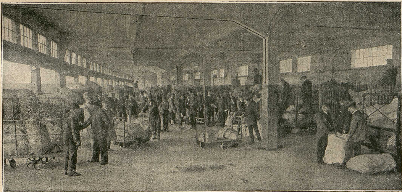
Feldpostensortierstelle in der Pakethalle auf dem Hauptbahnhof. Die Feldpostsammlung in Frankfurt a. M.