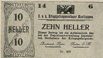
Kriegsgefangenenlager Mauthausen (Oberösterreich).