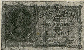
Vorder- und Rückseite (verkleinert) des belgischen 1-Frang-Scheines (eine Seite französisch, die andere flämisch).