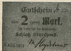
Schloß Storchneß (Posen).