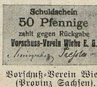
Vorschuss-Verein Wiehe (Provinz Sachsen).