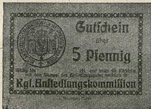
Kgl. Anlieferungskommission für Westpreußen und Posen.