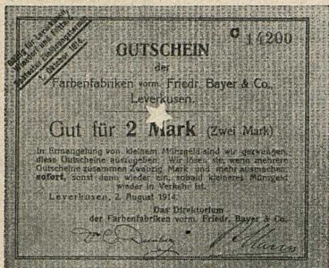
Farbenfabrik vorm. Friedr. Bayer & Co., Leverkusen (Rheinprovinz).