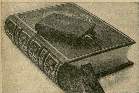
Das Buch des Priesters und das Buch des Laien Laacher Missale und der „Schott“

Der Verfasser des Beuroner Laienmischbuches