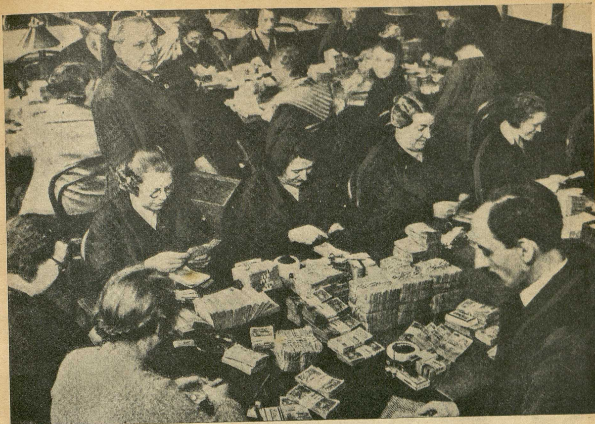
Im Notensortierraum der Österreichischen Nationalbank