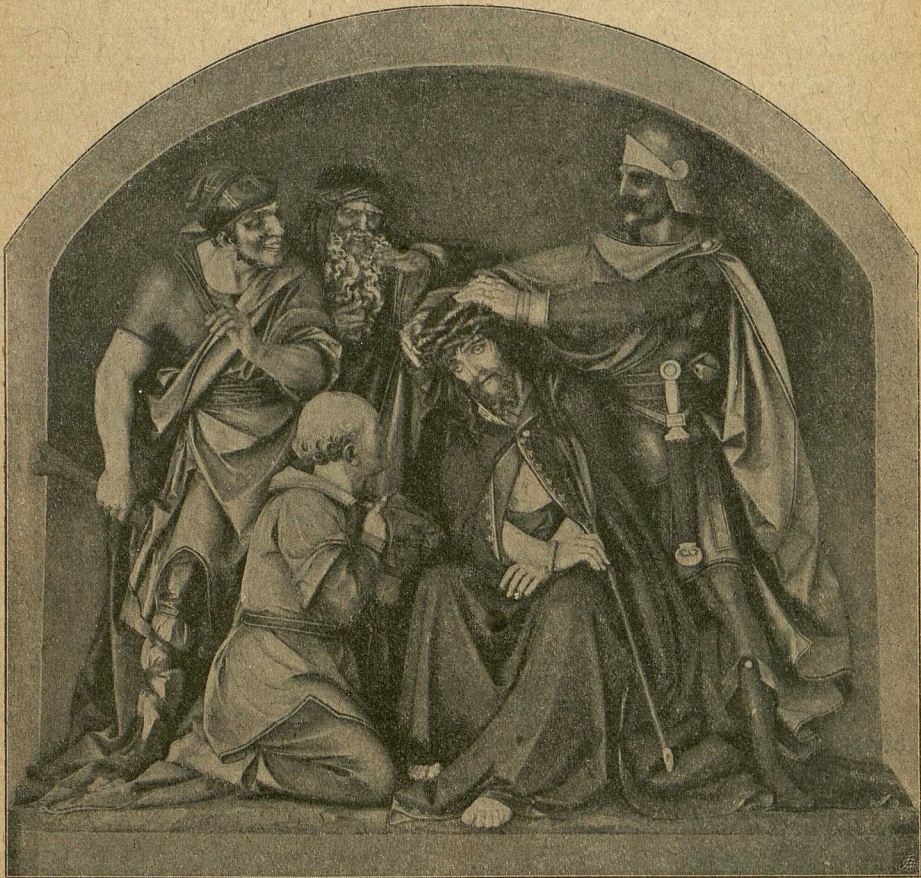
Die Dornenkrönung des Heilandes. (Von Bildhauer Huber.)

tungen von diesen nur Gutes hörten, Trost und Aufmunterung und Anweisung zu einem guten, gewissenhaften Leben erhielten! So aber ist es ein Jammer! Der weitaus größte Teil der Zeitungen ist unchristlich, ja direkt glaubens- und kirchen-