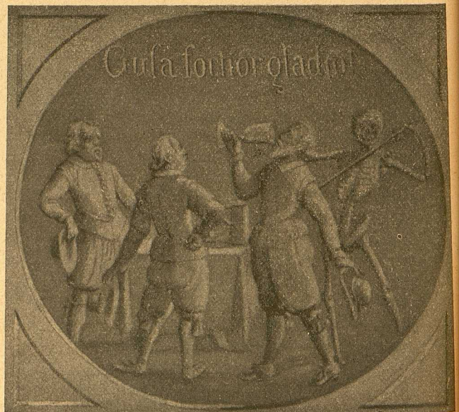
Solzschnitzerei auf einer Pfarrhofsthüre in Buchkirchen bei Wels. Nr. 2.