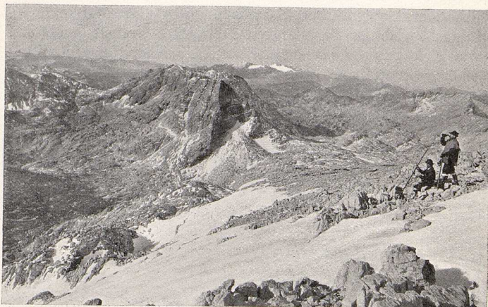
In der Felsenwüste des „Toten Gebirges“. (Im Hintergrunde der Dachstein).

abgedrängt werden mußte, zu bereisen. Immer angesichts hehrer Bergriesen wird das sich entrollende Bild fortwährend prächtiger, je mehr man sich dem „Gesäuse“ nähert. Kulmburg oder Frauenberg thront auf grünem Hügel, Stift und Markt Admont breitet sich im Tale aus. Das schöne Benediktinerstift besitzt eine große berühmte Bibliothek, der freund-