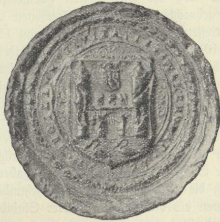
Stadtsiegel aus dem 17. Jahrhundert.

Der Stadtrechtsbrief, der an anderer Stelle eingehend besprochen wird, brachte übrigens neben einer Änderung des Ortswappens und Ortsiegels nicht wesentlich neue Rechte. Im Stadtbrief heißt es zwar, daß die Schwanenstädter Bürger von nun an alle „Freiheiten, Vortl (=Vorteile), Recht und Gerechtigkeiten und bürgerlicher Ämter Gewerbe u. Handlungen“ wie die anderen Städte Oberösterreichs genießen sollen; aber abgesehen davon,