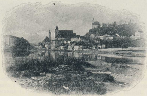
Steyr, Vorstadt Ort

sich bis zur Grenze Steiermarks, im Steyrtale bis Molln und in die Breitenau, auch nach Niederösterreich erstreckt, wurde von der Sektion Steyr des Deutschen und Oesterreichischen Alpenvereins und