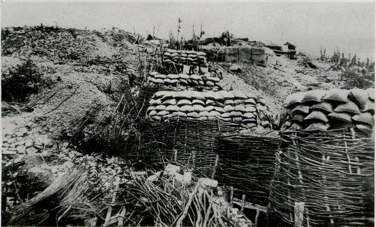
Blick vom rechten Flügel der Hauptstellung auf „Cimone Süd“ gegen Osten

Eine Grundforderung für das Gelingen der gegen die feindliche Stellung am Gipfel des Mte. Cimone geplanten Unternehmung war unter anderem auch der Ausbau unserer Kampf-, Lauf- und Verbindungsgräben. Unsere Hauptstellung präsentiert sich kurz vor der Gipfelsprengung als ein tief in den Fels gesprengter, stark traversierter und durch Flechtwerk gesicherter Kampfgraben. Im Bilde rückwärts ist die die Aussicht gegen den Gipfel behindernde Kote 1217 zu erkennen.