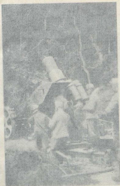
Der bei Draghi, unter Mitwirkung von Mannschaften des III. Baons eingebaute 30.5-cm-Mörser

In knapp vier Stunden ist das Geschütz, das ein Gesamtgewicht von 20.000 Kilogramm besitzt, eingebaut.