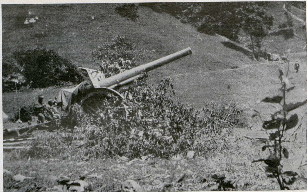
Skoda 14.9-cm-Langrohrkanone in Feuerstellung bei Longhi im Freddotal

Wir schlendern gemütlich zu den Artilleriestellungen, um uns die Sache einmal aus der Nähe zu besehen. Dort am Talhang steht eine weittragende Skoda-Langrohrkanone. Nach jedem Schuß, der unser Trommelfell in unliebsame Schwingungen versetzt, gleitet das schwere Rohr sanft rück- und wieder vorwärts. Die Bedienung des Ge-