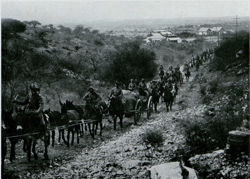
Eine Munitionskolonne verläßt Windhut, den Sammelpunkt der Truppenteile des Nordbezirks.