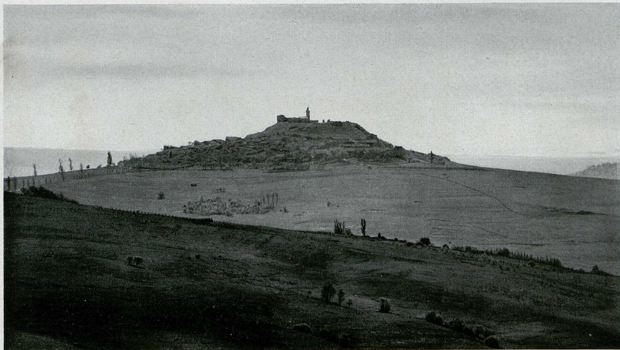
Über Pont à Mousson erhebt sich steil und beherrschend die Moussonhöhe, ein Wahrzeichen der dortigen Landschaft.