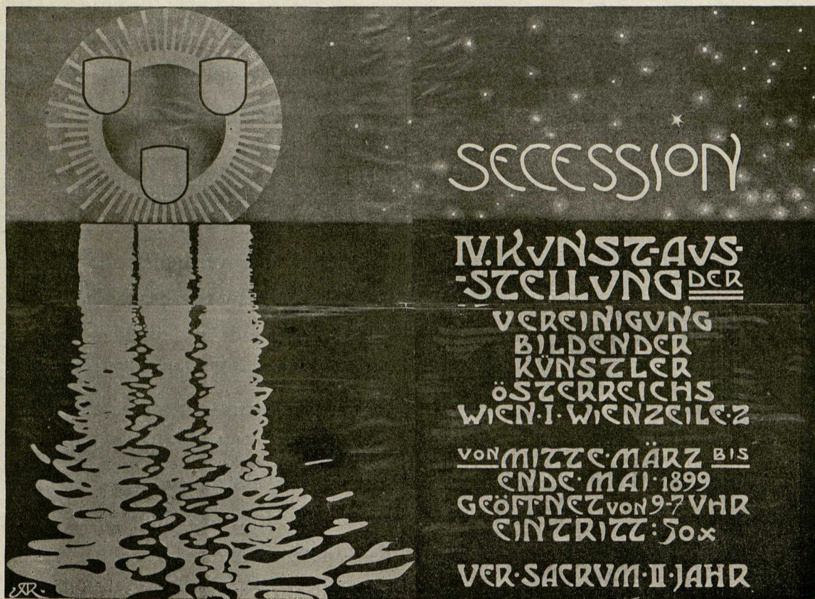
Abb. 44. Alfred Roller. IV. Ausstellung der Secession. 106:145. Druck von Albert Berger, Wien.

stilisiert (Abb. 48). Es ist ein Ausschnitt aus der Wandverkleidung, die den Hintergrund für Beethoven gebildet hat. Das blutende Medusenhaupt für die Slevogt-Ausstellung 1897 (Abb. 46), und sein Plakat für Richard Strauss' „Rosenkavalier“ sind noch in frischer Erinnerung. Auch die Plakate für die XII., dann die XVI. Ausstellung (Abb. 47) der Secession sind seine Schöpfungen.