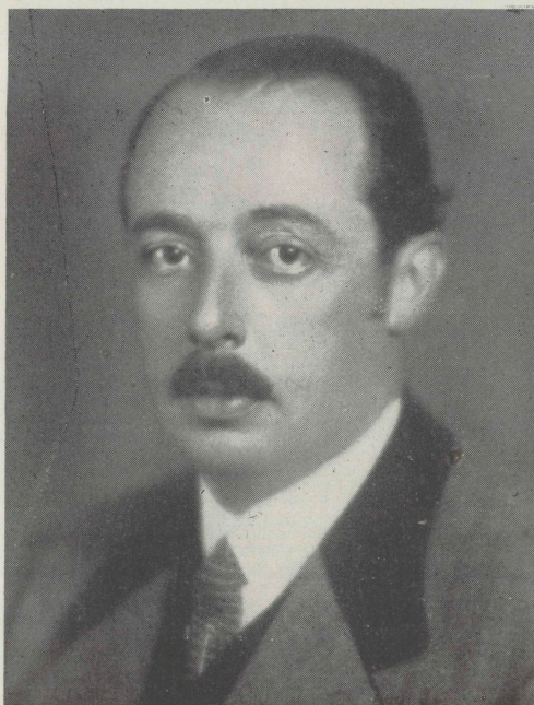
Berthold Graf Stürzgh