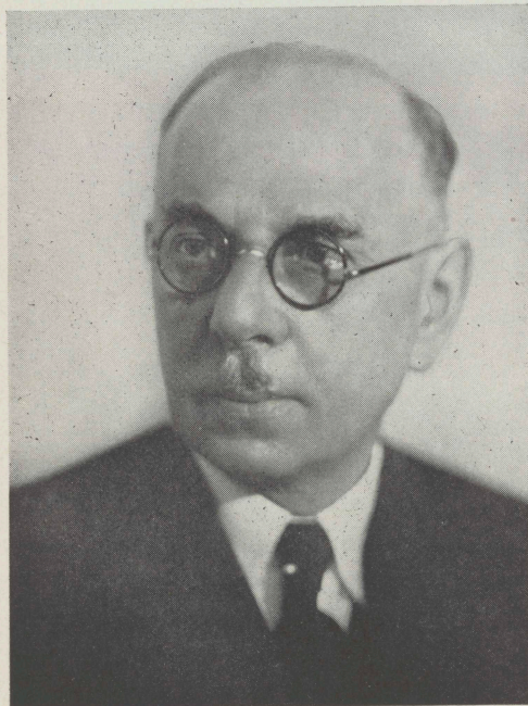
Dr. Wolfgang Pauli