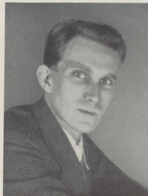
Dr. Walter Heinrich

Bundesminister für Handel und Verkehr a. D., Präsident der Österreichischen Radio-Verkehrs A. G. in Wien und Direktor des Gewerbebeförderungsinstituts der Wiener Handelskammer, 1919—1920 Mitglied der Konstituierenden Nationalversammlung, 1920—1921 Staatssekretär für Handel, Gewerbe, Industrie und Bauten, 1920—1934 Mitglied des Nationalrates.