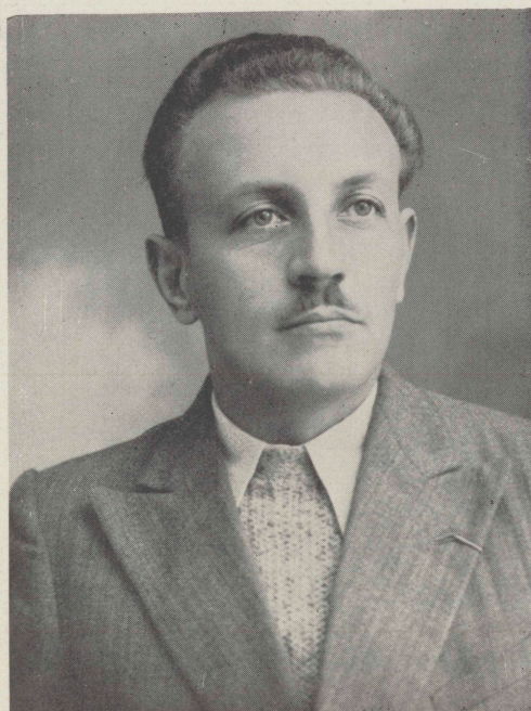
Gustav Bogensberger Weiz

Oberlandesamtsrat, seit 1927 Direktorstellvertreter der Oberösterreichischen Landesbrand- schadenversicherungs-Anstalt, 1933 zum Vor- standsmitglied des Oberösterreichischen Volks- credits, 1934 zum Mitglied des Beirates der Landeshauptstadt Linz ernannt, seit 1934 Bür- germeister der Landeshauptstadt Linz, 1915 bis 1918 Frontdienst.